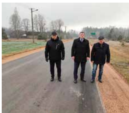
Wjazd do Rykowa od strony Jabłonicy.