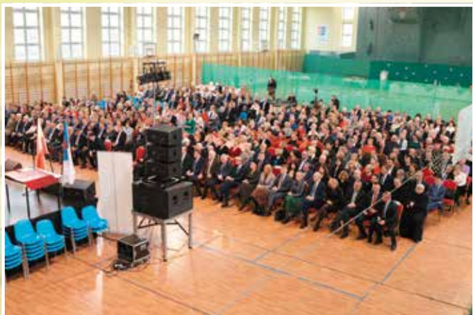
Udział w spotkaniu noworocznym organizowanym przez starostę wzięło w tym roku ponad 500 osób.