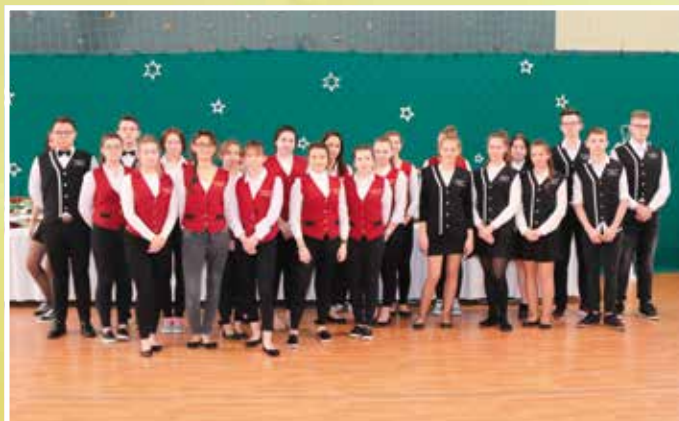
Spotkanie noworoczne przygotowali uczniowie i pracownicy ZS 2 w Przysusze.