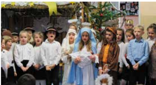
Uczniowie PSP Nr 2 w Przysusze.