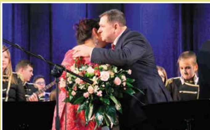
Kwiaty od organizatorów dla artystów za wspaniałe przeżycia duchowe.