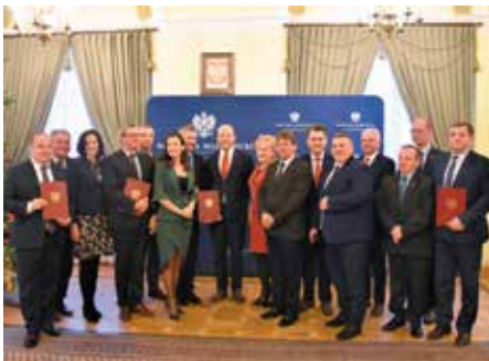
Przedstawiciele samorządów, które dzięki współpracy z Wojewodą reaktywują lokalne połączenia autobusowe.