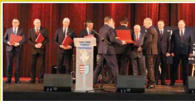
Pamiątkowe dyplomy dla gospodarzy gmin z okazji 30 lecia reformy.