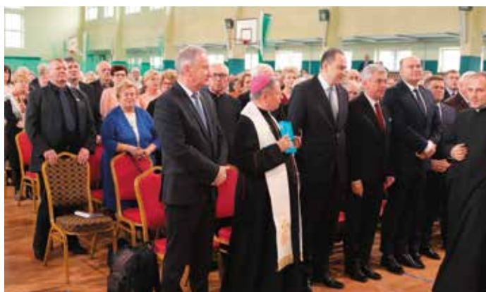
Wielu znakomitych uczestników przybyło na spotkanie noworoczne powiatu przysuskiego.

początku czasu powojennego było absolutnie niewykonalne. Doprowadziły główne arterie komunikacyjne na