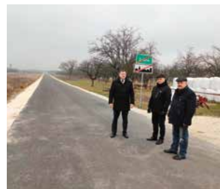
Nowa droga do Żukowa.