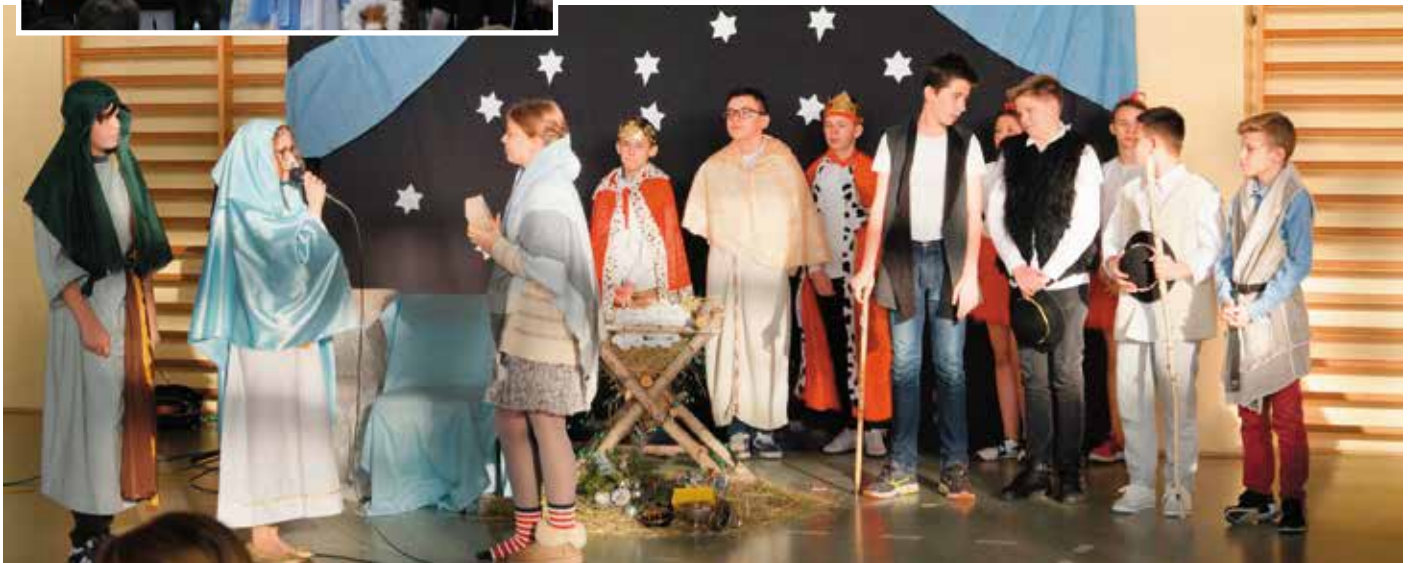
Uczniowie PSP Nr 1 w Przysusze.