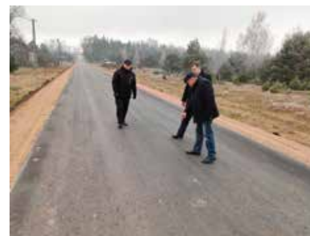
Panowie z ogromną starannością ocealili jakość wyonywanych prac na drogach.