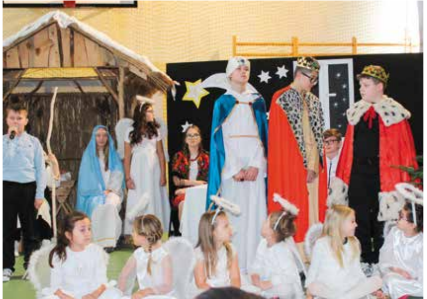
Uczniowie PSP Nr 2 w Przysusze.