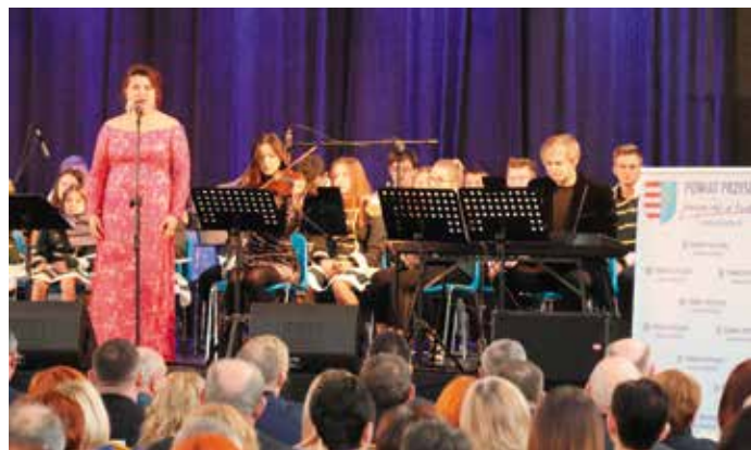
Spotkanie zwińczył bardzo dobrze przyjęty koncert lokalnych mistrzów estrady.