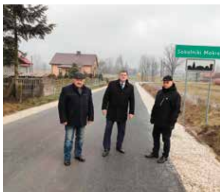
Wjazd do Sokolnik Morych.