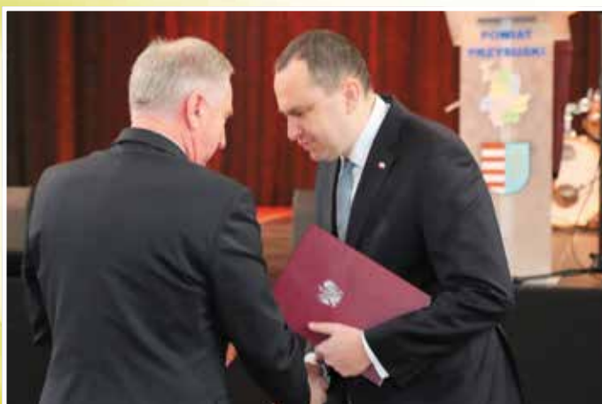
List od Prezydenta Andrzeja Dudy przekazuje Staroście minister Adam Kwiatkowski.