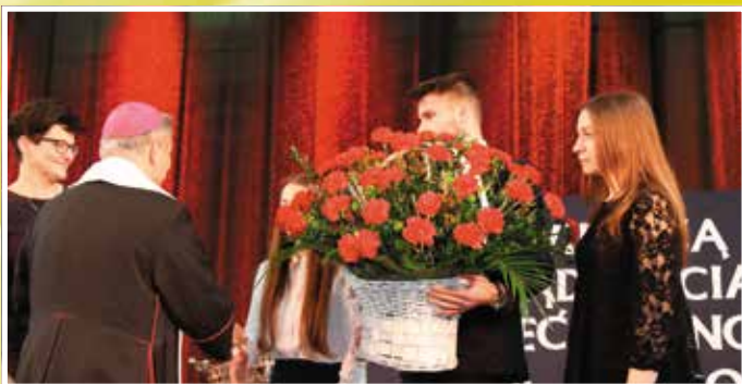
Kwiaty z podziękowaniem za mądre i dobre słowo.