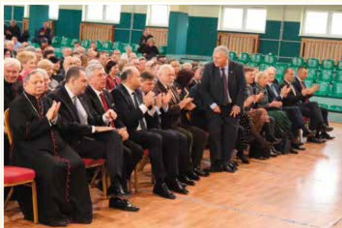
Jak co roku na spotkaniu nie zabrakło wybitnych przedstawicieli życia politycznego.