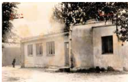
Świetlica wiejska w Bieliniach - kiedyś.

W okresie tym wybudowano ponad 90% istniejącej sieci wodociągowej wynosi 71,18km. Woda do sieci gminnej jest dostarczana z 4 ujęć: Rozwady Brzezinki, Jastrzęb, Zygmuntów. Stacja uzdatniania wody w Zygmuntowie jest w pełni zautomatyzowana. Następną inwestycją z zakresu infrastruktury sanitarnej była budowa oczyszczalni ścieków oraz kolejnych odcinków sieci kanalizacyjnej, która to sieć jest nadal budowana w kolejnych miejscowościach. W minionym okresie na wielu drogach gminnych i ulicach wykonano nawierzchnię asfaltową i chodniki. Prowadzona była współpraca ze starostwem powiatowym w zakresie modernizacji dróg powiatowych na terenie gminy. Minione lata to praca na rzecz poprawy warunków działalności społeczno-kulturowej, remont budynku Gminnej Biblioteki Publicznej w Gielniowie, świetlic wiejskich w Jastrzębiu, Goździkowie, Rozwadach, Snarkach i obecnie trwający remont budynku świetlicy w Bieliniach. Kluczowym zadaniem w okresie młodej lokalnej demokracji był nacisk na poprawę warunków edukacji najmłodszej grupy naszego społeczeństwa. W latach