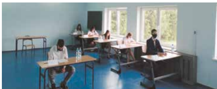
Publiczna Szkoła Podstawowa w Rozwadach.

Przystąpienie do egzaminu ósmoklasisty jest warunkiem ukończenia szkoły podstawowej. Tegoroczny egzamin odbył się w nietypowych warunkach. Nie tylko stres towarzyszył uczniom w związku z egzaminami ale i obawa związana z epidemią koronawirusa, na egzaminie obowiązywał reżim sanitarny. Mimo to uczniowie jak i nauczyciele nie opuszczają wiary w to, że będzie jeszcze pięknie i w dobrych nastrojach oczekują na wynik egzaminu, które poznają do 31 lipca. Wynik egzaminu wpływa na przyjęcie ucznia do wybranej przez niego szkoły ponadgimnazjalnej. Życzymy więc naszym uczniom jak najlepszych wyników.