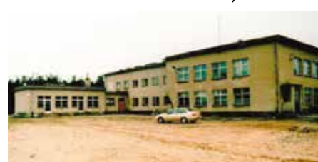
Budynek szkoły w Gielniowie. - kiedyś.

Wójt Gminy w Gielniowie Władysław Czarnecki