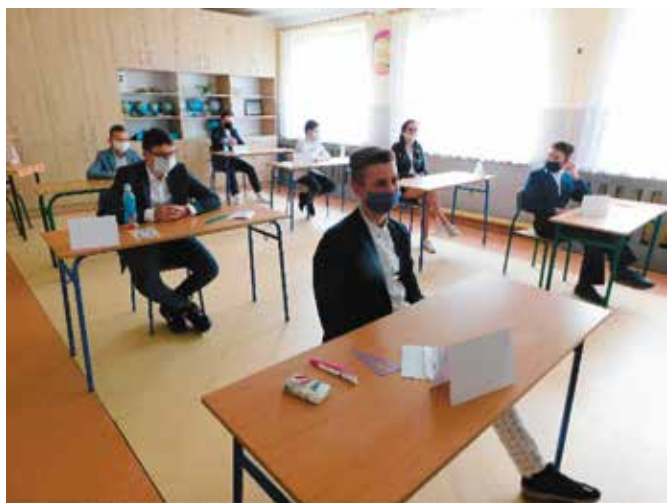
Publiczna Szkoła Podstawowa w Bielinach.

Przystąpienie do egzaminu ósmoklasisty jest warunkiem ukończenia szkoły podstawowej. Tegoroczny egzamin odbył się w nietypowych warunkach. Nie tylko stres towarzyszył uczniom w związku z egzaminami ale i obawa związana z epidemią koronawirusa, na egzaminie obowiązywał reżim sanitarny. Mimo to uczniowie jak i nauczyciele nie opuszczają wiary w to, że będzie jeszcze pięknie i w dobrych nastrojach oczekują na wynik egzaminu, które poznają do 31 lipca. Wynik egzaminu wpływa na przyjęcie ucznia do wybranej przez niego szkoły ponadgimnazjalnej. Życzymy więc naszym uczniom jak najlepszych wyników.