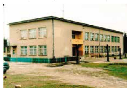
Budynek szkoły w Gielniowie - kiedyś.