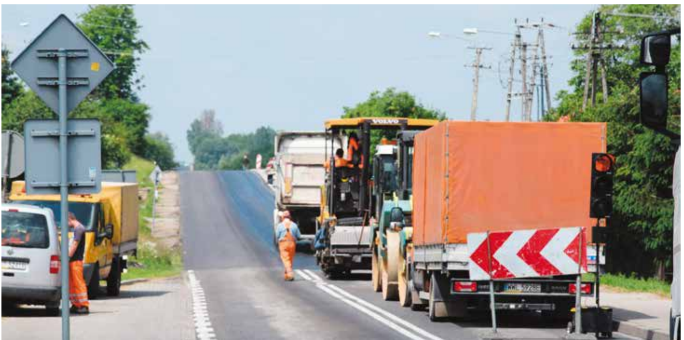
Remont drogi wojewódzkiej 727

z Urzędu Marszałkowskiego dla typu operacji „Budowa lub modernizacja dróg lokalnych” w ramach poddziałania „Wsparcie inwestycji związanych z tworzeniem, ulepszeniem lub rozbudową wszystkich rodzajów małej infrastruktury objętego PROW na lata 2014-2020 w wysokości 63,63% poniesionych kosztów kwalifikowalnych operacji tj. 219 tys. zł oraz środków własnych Gminy. Na terenie gminy wykonany został remont drogi wojewódzkiej 727 od ul. Gródek w Ruskowicach do ul. Stawowej w Borkowicach. W ramach tego zadania została położona nawierzchnia bitumiczna, wyremontowane zostały pobocza, zatoka przystankowa, udroźnione i pogłębione rowy, zrobione wjazdy ma posesję oraz została wymieniona kostka brukowa obok cmentarza. W b.r. powiat przysuski wykona remont ul. Spacerowej w Borkowicach na odcinku 1204 m.