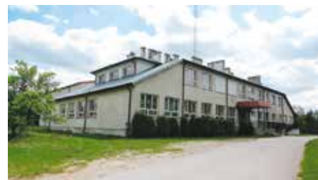
Publiczna Szkoła Podstawowa w Rozwadach - obecnie.

Pragnę podziękować mojemu poprzednikowi, pierwszemu Wójtowi Gminy Gielniów wybranemu