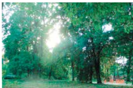
Park w Wywozie- kiedyś.