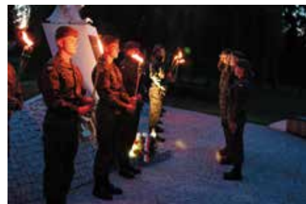
Żołnierze oddają hołd powstańcom walczącej Warszawy.