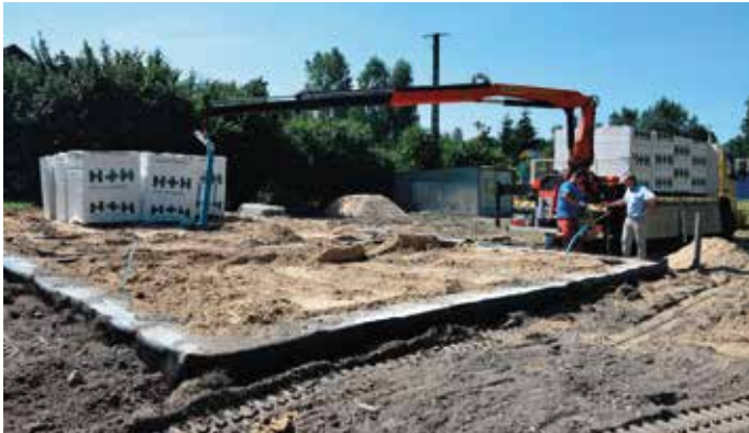
Budowa świetlicy w niskiej jabłonce.

się również przebudowa odcinka drogi o dł. 550 mb w Ninkowie. Na terenie gminy realizowane jest pięć zadań w ramach Mazowieckiego Instrumentu Aktywności Sołectw: budowa altany w Rudnie, budowa altany w Radestowie, budowa altany w Woli Kuraszowej, modernizacja infrastruktury rekreacyjno-sportowej we wsi Rzuców oraz wykonanie placu zabaw i siłowni plenerowej w Rusinowie. Trwa budowa boiska do piłki siatkowej przy Zespole Szkół Podstawowych w Rzucowie. Wykonawcą robót jest firma Nakal z Nowego Miasta.