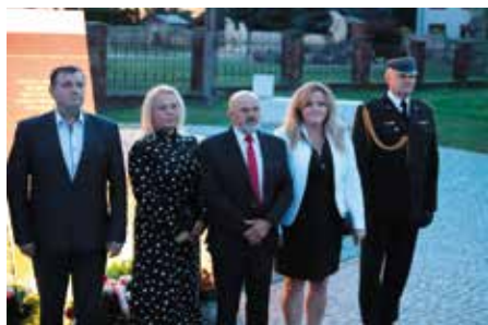
Uczestnicy uroczystości przy Pomniku Orła Białego.