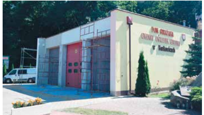
Remont strażnicy w Borkowicach.