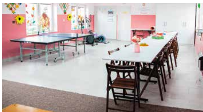
Świetlica wiejska w Krajowie.

trek, biegacz, wioślarz, surfer, stepper, twister oraz tai chi dla dzieci. Zrealizowane zadania przyczyniły się do uatrakcyjnienia wspomnianych miejscowości, stworzyły miejsca aktywności dla mieszkańców, sprzyjające wypoczynkowi oraz zachęcające do aktywności fizycznej. Zakupione do świetlic wiejskich wyposażenie, oferuje ciekawsze i dogodniejsze warunki do spędzania wolnego czasu przez dzieci i młodzież oraz do integracji społecznej. Całkowita wartość zrealizowanych zadań wyniosła prawie 100 tys. złotych.