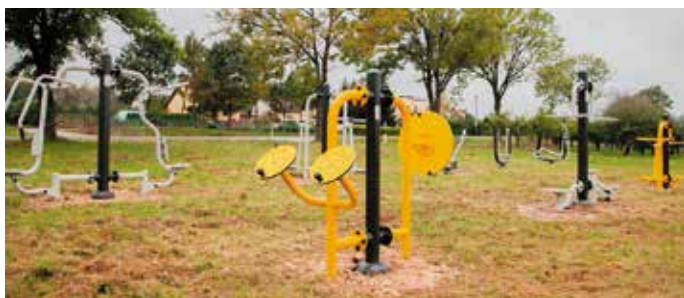
Siłownia zewnętrzna w Zawadzie.

W październiku br. Gmina i Miasto Przystucha zakończyła realizację projektów współfinansowanych ze środków budżetu Województwa Mazowieckiego w ramach „Mazowieckiego Instrumentu Aktywizacji Sołectw MAZOWSZE 2020” polegających na: -wypożyczeniu świetlicy wiejskiej w Dębinach oraz w Krajowie w sprzęt AGD, RTV, komputerowy, sportowy oraz nowe meble i gry zręcznościowe, -budowie altany w Hucisku, -zakupie urządzeń na plac zabaw przy świetlicy wiejskiej w Pomykowie takich jak: wielofunkcyjny zestaw zabawowy, karuzela tarczowa oraz kółko-krzyżak, -montażu siłowni zewnętrznej w Zawadzie wyposażonej w urządzenia typu: orbi-