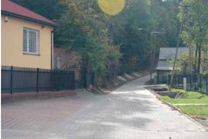
Przebudowana droga gminna ul. Leśna w Borkowicach

Wykonano przebudowę drogi gminnej ul. Leśna w Borkowicach. Na odcinku o długości 120m wykonano nawierzchnię z kostki brukowej betonowej szarej