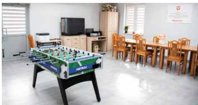
Świetlica wiejska w Dębinach.