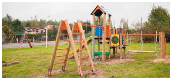
Plac zabaw w Pomykowie.

trek, biegacz, wioślarz, surfer, stepper, twister oraz tai chi dla dzieci. Zrealizowane zadania przyczyniły się do uatrakcyjnienia wspomnianych miejscowości, stworzyły miejsca aktywności dla mieszkańców, sprzyjające wypoczynkowi oraz zachęcające do aktywności fizycznej. Zakupione do świetlic wiejskich wyposażenie, oferuje ciekawsze i dogodniejsze warunki do spędzania wolnego czasu przez dzieci i młodzież oraz do integracji społecznej. Całkowita wartość zrealizowanych zadań wyniosła prawie 100 tys. złotych.