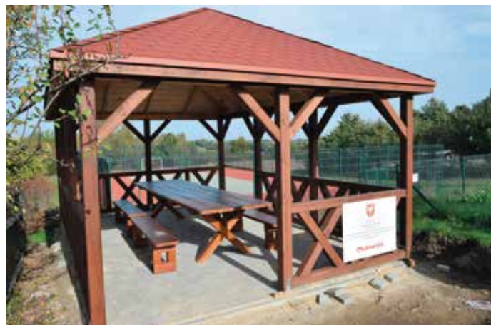
Altanka w Rudnie.