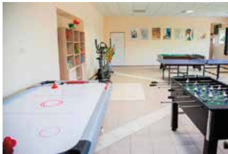
Wyremontowana świetlica w Smogorzowie.