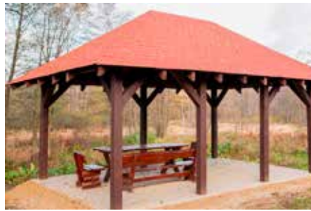
Altana w Hucisku.