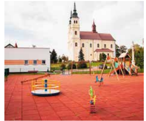
Plac zabaw w Skrzyńsku.