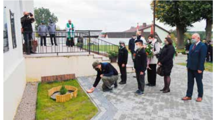
Radni Gminy i Miasta Przystucha, Dyrektor Domu Kultury w Przysusze oraz Harcerze pod pamiątkową tablicą złożyli kwiaty i zapalili znicze pamięci.