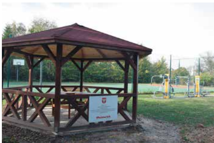
Altanka w Radestowie.

karuzela obrotowa, zestaw zabawkowy ze zjeżdżalnią oraz siłownia plenerowa wyposażona w biegacza + orbitrek oraz motyla + wyciąg górny. Realizacja zadań umożliwi aktywne spędzanie czasu na świeżym powietrzu oraz integrację lokalnej społeczności.