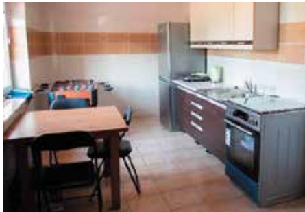
Świetlica wiejska w Janowie.