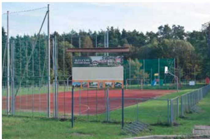
Boisko w Rzurowie.