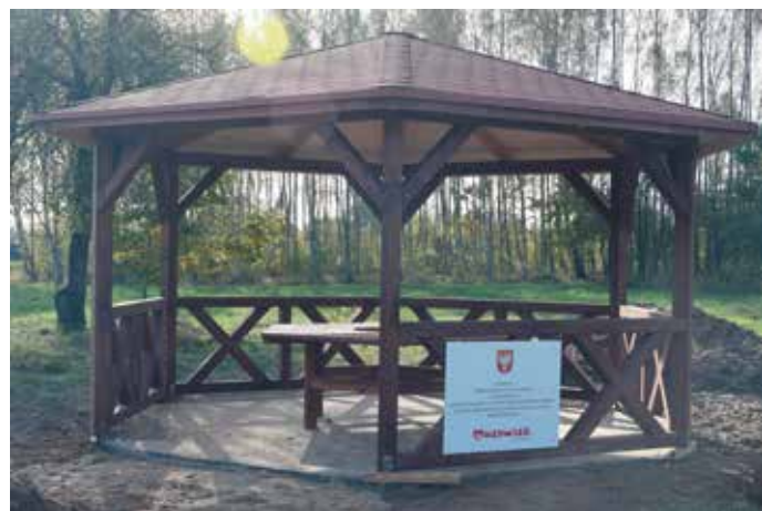
Altana w Woli Kuraszowej.