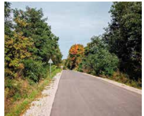
Wyremontowana ul. Leśna w Skrzyńsku.