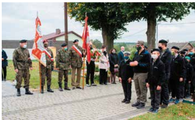
Uczestnicy uroczystości oddali hołd poległym.