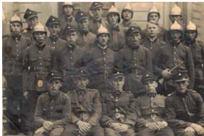
Oddział OSP Borkowice w 1942 roku