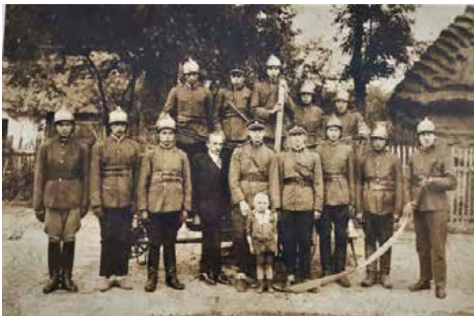
Oddział OSP w Borkowicach w 1928 roku