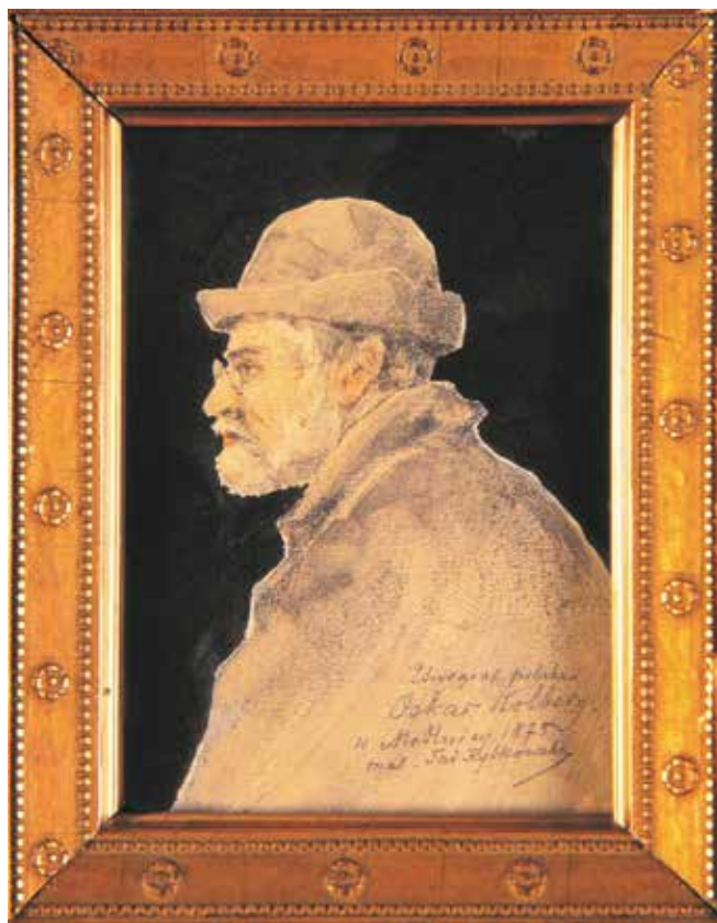
Tadeusz Rybkowski, Portret Oskara Kolberga, Modlnica 1875