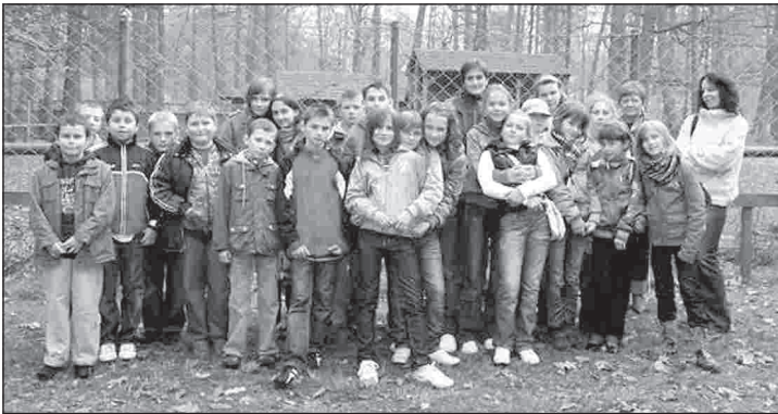
Tropem żubrów w Białowieży

W PSP w Skrzyńsku organizowano zajęcia z logopedą skierowane do dzieci z oddziałów przedszkolnych oraz uczniów pierwszego etapu edukacyjnego, zajęcia z psychologiem wspomagające ogólny rozwój dziecka i korekcyjno-kompensacyjne realizowane przez nauczyciela posiadającego kwalifikacje z zakresu terapii pedagogicznej. W ramach grupy zajęć mających na celu rozwój dziecięcych talentów funkcjonowały koła zainteresowań: matematyczne, informatyczne, pływackie połączone z nauką pływania z zajęciami na pływalni w Końskich, teatr żywego słowa, koło bibliotekarskie, polonistyczno-recytatorskie, zespół muzyczny, zajęcia tańca nowoczesnego, ko-