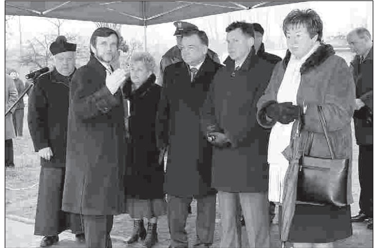
Burmistrz Gminy i Miasta Przysucha przywitał gości przybyłych na uroczystość nadania imienia rondo

czego, które miały miejsce w styczniu 1919 roku. Wybrany po raz pierwszy po latach niewoli polski parlament miał za zadanie ustabilizować demokratyczne władze państwa polskiego, uchwalić pierwszą Konstytucję i zorganizować państwo. Myślę - kontynuował Marszałek - że jest pewna symbolika w tym, że tutaj, w Przysusze zbiegają się ulice Legionów Polskich i Przemysłowa, a w środku rondo Wincentego Witosa. Legioniści zawsze będą symbolem idei wyzwoleniczej, a Wincenty Witos to jeden z największych polskich mężów stanu, reprezentant ruchu ludowego, ale przede wszystkim gorący patriota i demokrat. Natomiast ulica Przemysłowa to symbol rozwoju. Życzę wszystkim miesz-