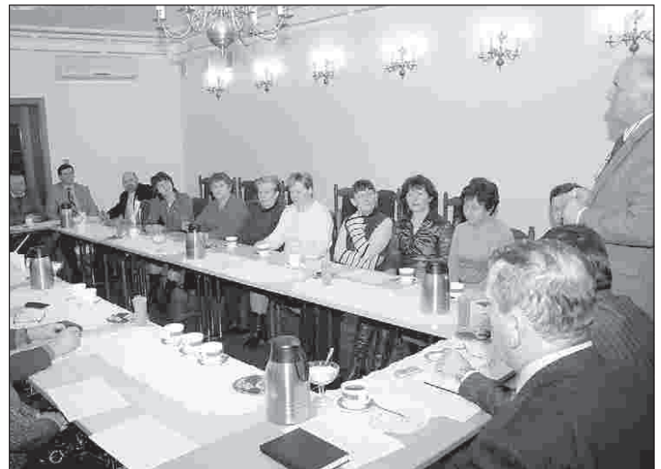
Sołtysi na corocznym spotkaniu z Burmistrzem Gminy i Miasta Przysucha