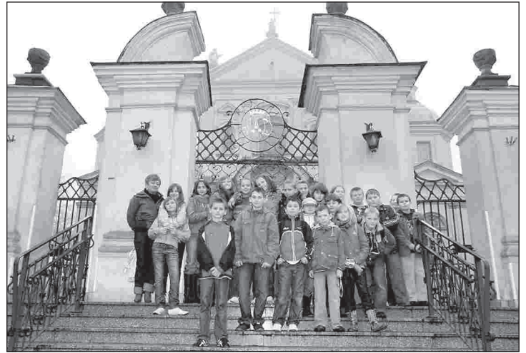
Przed sanktuarium w Poświętnem

ło młodego szachisty i zajęcia sportowe w zakresie mini siatkówki dziewcząt i chłopców. Atrakcyjną formą edukacyjną były wycieczki i wyjazdy o charakterze kulturotwórczym i turystycznym. Np. min. do kina „Helios” w Radomiu na film o życiu Jana Pawła II pt. „Świadectwo”, uczniowie obejrżeli w Domu Kultury w Przysusze spektakl „Księga dżungli” w wykonaniu artystów Nardo-