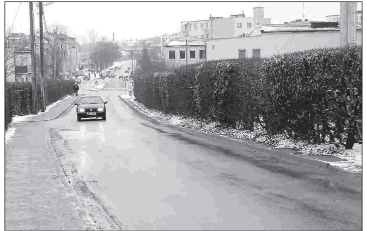
Aleja Jana Pawła II

stało na przeszkodzie, już w 2006 roku byłaby jak nowa. Projekt przebudowy al. Jana Pawła II, uwzględniający położenie nowej nawierzchni jezdni, wykonanie i poszerzenie chodników dla pieszych oraz parkingu obok Domu Kultury, wykonany na zlecenie Gminy i Miasta