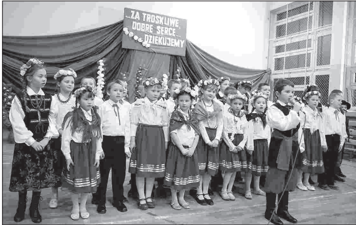
Dzieci przygotowały wzruszający program artystyczny

przybyłymi nauczycielami i rodzicami artystyczne popisy dzieci oklaskiwali radni Rady Gminy i Miasta Przysucha, Burmistrz Przy-