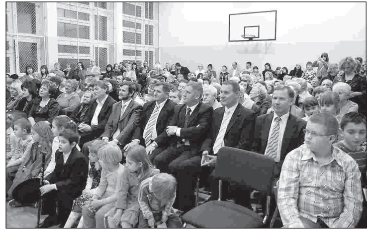
Na uroczystość z okazji Dnia Seniora przybyło wielu gości

Policyjne statystyki wskazują na wzrost liczby osób pokrzywdzonych w wyniku przemocy, a także na wzrost ilości sprawców wykroczeń dokonanych po użyciu alkoholu. Więcej także odnotowano w ubiegłym roku, aniżeli w 2007, przypadków, kiedy dzieci były świadkami interwencji. - To powód, aby jeszcze większy wysiłek skierować na profilaktykę