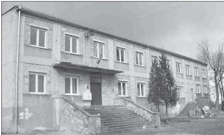
Budynek w Dębinach: dawniej szkoła, dziś mieszkania

wie największym zadaniem ubiegłego roku i bieżącego jest adaptacja na lokale socjalne budynku po byłej szkole w Dębinach. W latach 2007-2008 PSK wydała na ten cel ponad 80 tys. zł, w wyniku czego uzyskano 6 mieszkań na parterze oraz wyremontowano 13 piwnic.