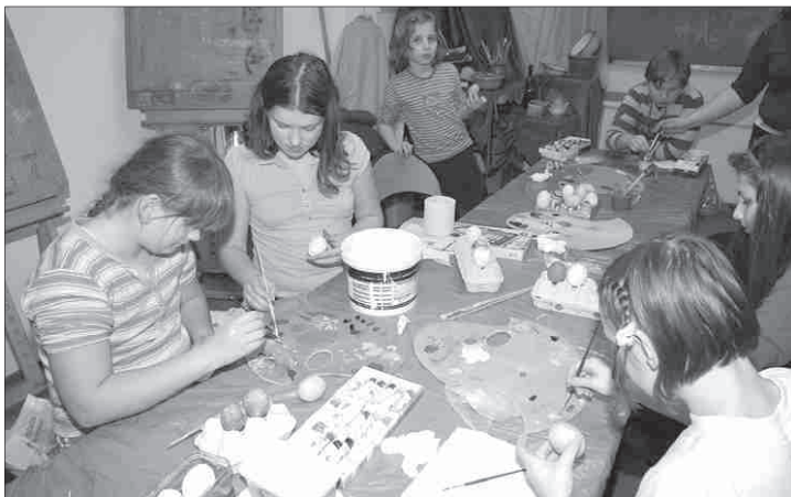
Wielkie malowanie pisanek

wstały więc piękne prace, które ozdobią świąteczne stoły. Pomysły i wykonanie pisanek pochwaliła prowadząca zajęcia plastyczne Bożena Michałek.