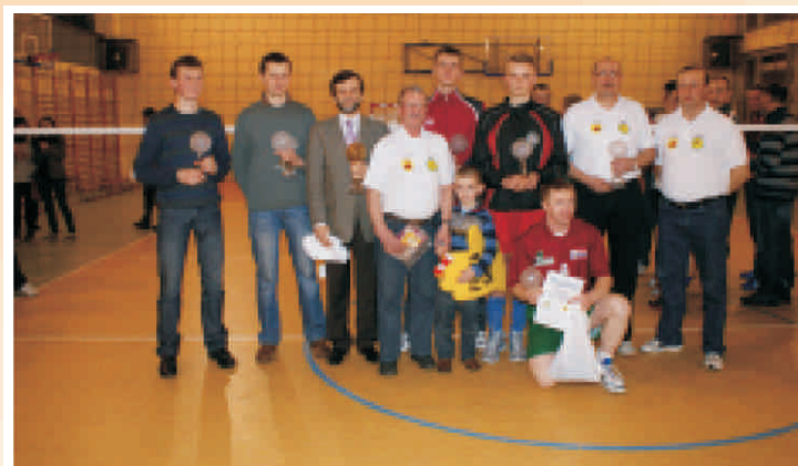
Wspólne zdjęcie wyróżnionych z Burmistrzem