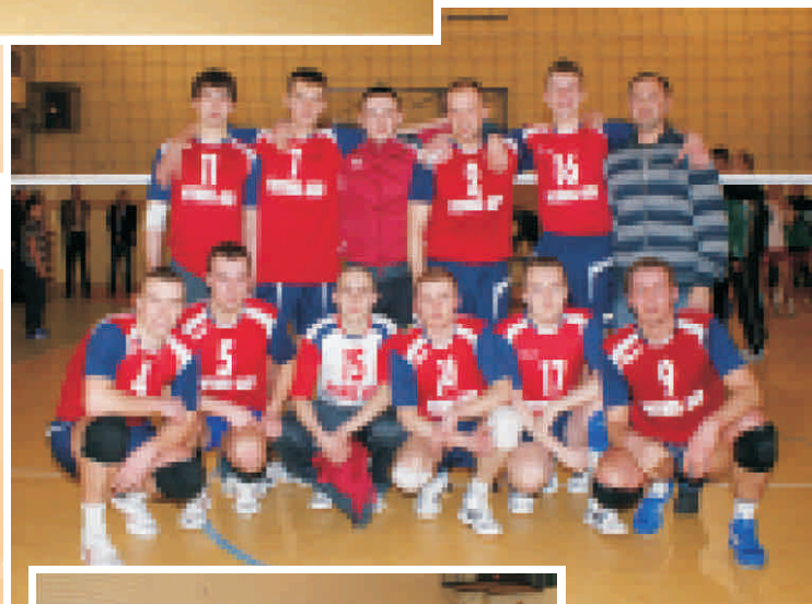
Zwycięski zespół Prymusa AGD Wolanów