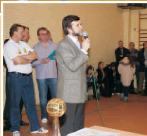
Burmistrz ogłasza zakończenie X edycji Przysuskiej Amatorskiej Ligi Piłki Siatkowej