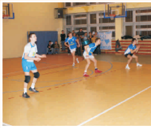
Pełna koncentracja przyjmujących Ogólniaka