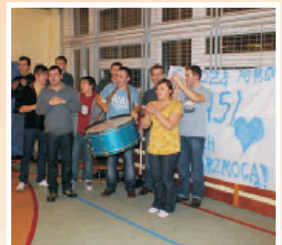
Fan Klub Ogólniaka