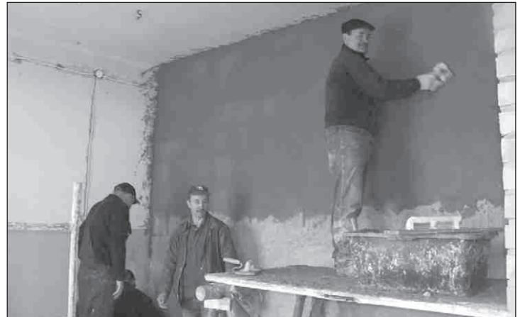
Prace remontowe w budynku, w Dębinach trwają

Prace adaptacyjne w budynku trwają. Ich dokończenie to podstawowe zadanie na rok 2009. Pracownicy aktualnie wykonują remont pomieszczeń na piętrze. Jak