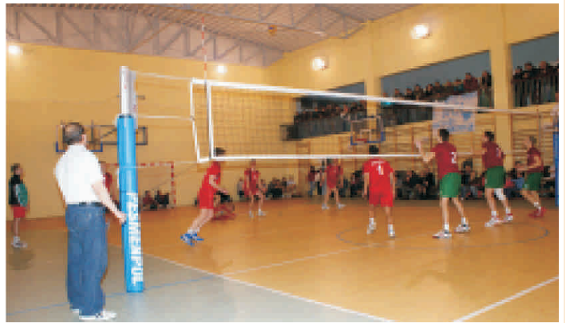
Mecz półfinałowy Hubal – Team