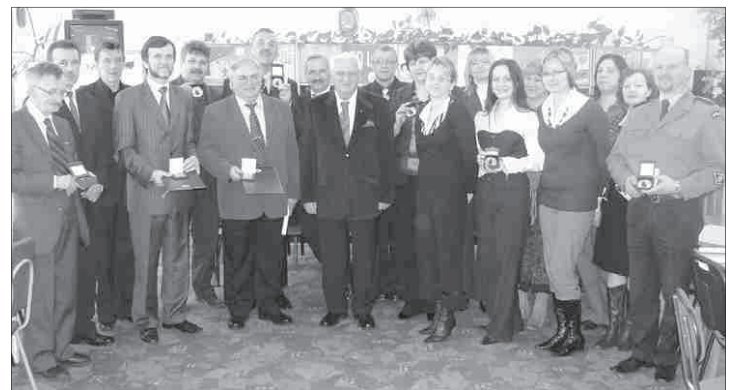
Uczestnicy jubileuszowego spotkania członków PCK i Klubu Honorowych Dawców Krwi.

Burmistrz Przysuchy w swoim wystąpieniu podziękował wolontariuszom, szczególnie zasłużonym honorowym dawcom krwi z naszej