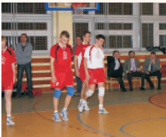
Zespół Hubala po reprimendzie trenera wchodzi na boisko