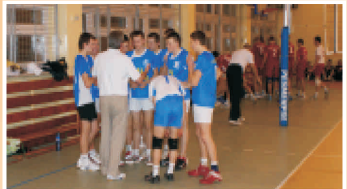
Czas dla drużyny Ogólniaka