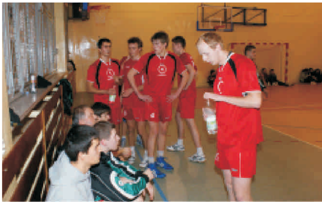
Hubal Chlewiska „na czasie”