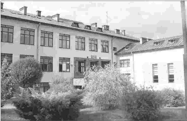
Budynek szkół w Mariówce.

Zaproszenie do szkół w Mariówce, do Prywatnego Liceum Ogólnokształcącego oraz Prywatnego Gimnazjum im. św. Królowej Jadwigi, dało możliwość zainteresowanej młodzieży zapoznania się z ofertą szkół w bezpośrednim spotkaniu. Podczas dwóch "Dni Otwartych Drzwi", goście mogli zwiedzić pomieszczenia szkolne oraz internatu w towarzystwie uczącej się tam młodzieży. To właśnie uczennice i uczniowie liceum i gimnazjum byli niejako głównymi gospodarzami dni "Otwartych Drzwi" w Mariówce. Oprowadzali przybyłych, opowiadali o szkole, dzielili się przeżyciami (czasami zapewne i szkolnymi mitami), starając się udzielić jak najpełniejszej informacji. Z pozostawionych ankiet oceniających te spotkania wynika, że spisali się rewelacyjnie. W poszczególnych salach i pracowniach lekcyjnych goście mogli porozmawiać z nauczycielami, którzy udzielali szczegółowych informacji o programach nauczania i wymaganiach z poszczególnych przedmiotów. W trakcie tych rozmów można było zapoznać się z osiągnięciami uczniów, zaprezentowanych w formie pokazu multimedialnego, po-