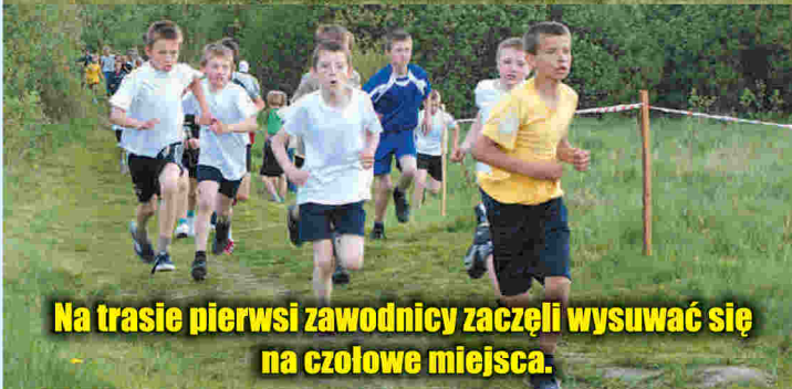
Na trasie pierwsi zawodnicy zaczęli wysuwać się na czołowe miejsca.