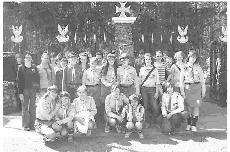
Harcerze z przysuskiego hufca ZHP w Anielinie.

kwietnia br. odbyły się rocznicowe uroczystości: msza polowa i apel poległych. W uroczystościach w Anielinie uczestniczyli harcerze z przysuskiego hufca ZHP oraz uczniowie z Publicznej Szkoły Podstawowej w Ruskim Brodzie, noszącej imię Hubalczyków. W przeddzień, w PSP w Ruskim Brodzie odbyły się uroczystości "Dnia Patrona" pt. "W ciemnym lesie pod jodeł zaciszem...". Uczniowie wystąpili w uroczystej akademii, której treści zostały oparte na twórczości poetki ludowej