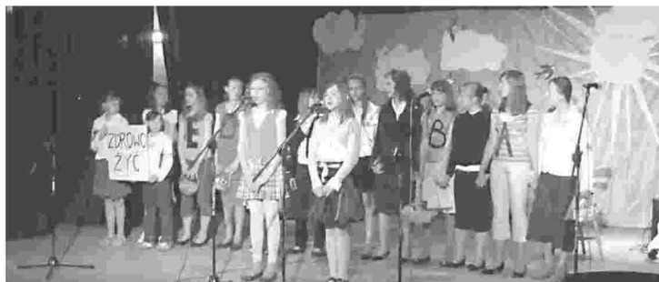
Inszenizacja teatralna "Zdrowo żyć" w wykonaniu uczniów PSP w Skrzyńsku