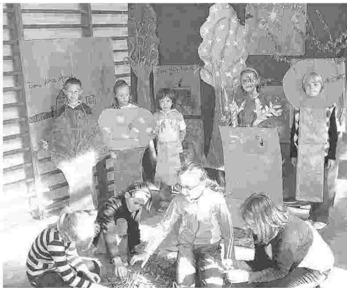
Uczniowie PSP im. Hubalczyków w Ruskim Brodzie w inscenizacji poświęconej pamięci Hubala.