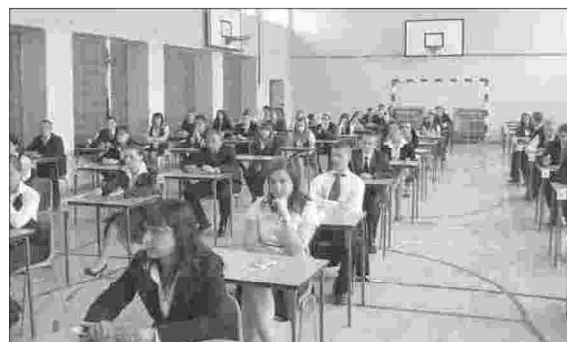
Maturzyści ZS nr 2 przed egzaminem pisemnym.

Ponad 400 maturzystów z Zespołów Szkół nr 1 i nr 2 w Przysusze przystąpiło do egzaminu dojrzałości. Ogółem z dziewięciu klas trzecich mury szkoły opuści 236 absolwentów