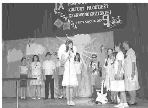
Dzieci z PSP nr 1 w Przysusze przeprowadziły wywiad z siostrą PCK

- W organizacji imprezy pomogli wydatnie pracownicy Domu Kultury w Przysusze oraz zaprzyjaźnione firmy, które ufundowały uczestnikom słodki poczęstunek - podkreśla Franciszek Filipczak i dodaje, że obok przeglądu kultury czerwonokrzyskiej stowarzyszenie nagrodziło książkami i dyplomami uznania 125 wolontariuszy honorowego krwiodawstwa - uczniów Zespołów Szkół nr 1 i nr 2 w Przysusze.