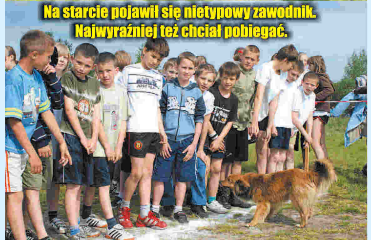
Na starcie pojawił się nietypowy zawodnik. Najwyraźniej też chciał pobić.