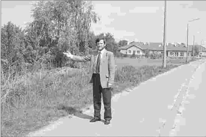
Jeszcze dziś teren niezagospodarowany, jesienią tu będzie Orlik - pokazuje Burmistrz Przysuchy

- Przysucha przygotowuje się do obchodów swojego święta. Rok temu na Dni Przysuchy i Dni Kolbergowskie oddano muszlę koncertową w nowej szacie. Czy w tym roku władze Gminy i Miasta, mając na uwadze jubileuszowe obchody, szykują na tę okoliczność podobny prezent?