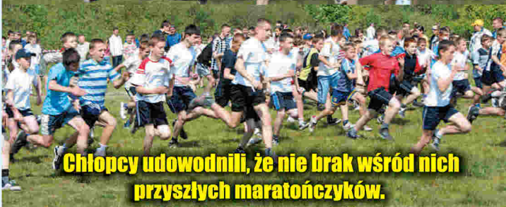
Chłopcy udowodnili, że nie brak wśród nich przyszłych maratończyków.