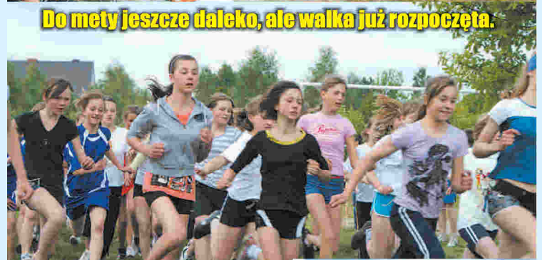
Do mety jeszcze daleko, ale walka już rozpoczęta.