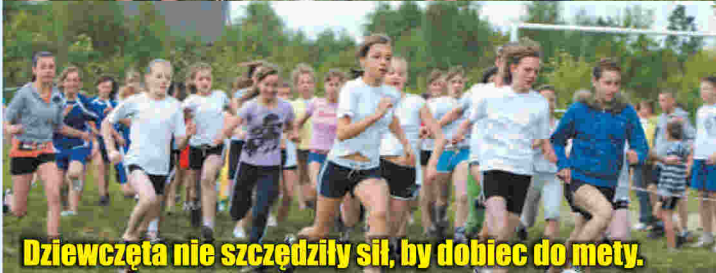
Dziewczęta nie szczędziły sił, by dobiec do mety.