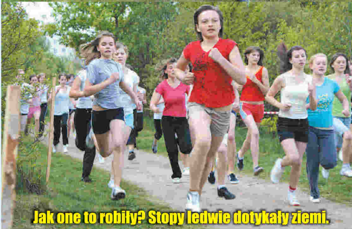
Jak one to robiły? Stopy ledwie dotykały ziemi.