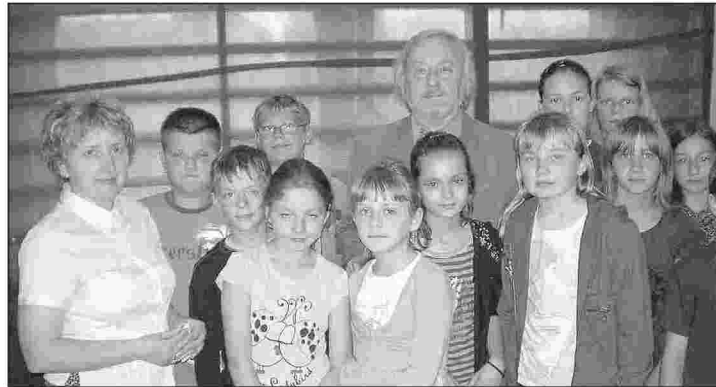
Pamiątkowe zdjęcie z autorem „Baśni i Legend Ziemi Radomskiej”