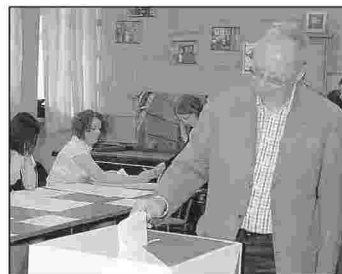
Jacek Kozłowski, wojewoda mazowiecki głosował w Przysusze

W Gminie i Mieście Przysucha na 10603 osoby uprawnione do głosowania, do urn poszło 2001 osób, tj. 18,87 proc. Najwyższą frekwencję odnotowała Komisja Wyborcza w Smogorzowie (25,5%), najniższą w Dębinach (7,1%). W mieście Przysucha frekwencja wyniosła 23,5%. W Gminie i Mieście Przysucha wygrał PiS, uzyskując 35,4% głosów