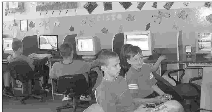
Sala komputerowa świetlicy stowarzyszenia „Opoka” czynna będzie przez całe wakacje

łki siatkowej plażowej, terminy zostaną podane na ogłoszeniach po uzgodnieniu z zainteresowanymi. W ramach wypoczynku letniego DK planuje również zorganizowanie wycieczki autokarowej do Bałtowa. W programie wycieczki między innymi zwiedzanie parku jurajskiego i spływ rzeką Kamienną. W okresie wakacyjnym planuje również zorganizowanie koncertów w parku miejskim. 28 czerwca zagrały już zespół „The Road” oraz Kwartet Jazzowy, natomiast na 19 lipca przewidziany jest koncert zespołów rockowych oraz w sierpniu przegląd kapel weselnych. Termin przeglądu kapel zostanie podany po uzgodnieniu z zespołami, które chcemy zaprosić do udziału