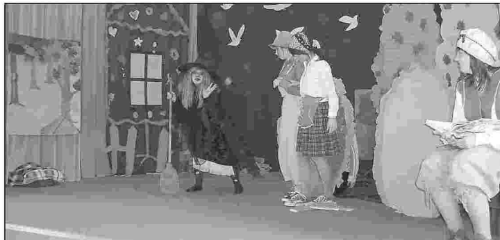
Bajka „Jaś i Małgosia” w wykonaniu I kl. Licealnej