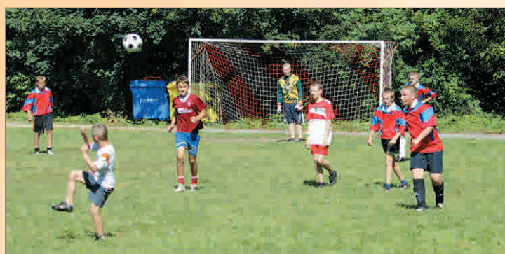
UKS Biedronka kontra SKS Smogorzów