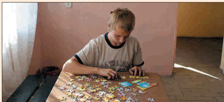
Chwila relaksu przy układaniu puzzli w świetlicy w Janowie