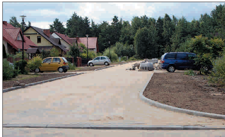
Budowa ul. Sikorskiego w Przysusze. Koszt inwestycji 166,9 tys. zł