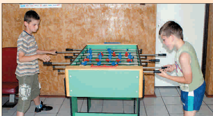
Trening w świetlicy w Krajowie, później sukcesy na boisku