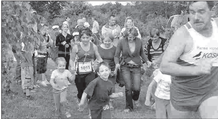
Uczestnicy Prywatnego Wiejskiego Biegu Przysucha/Janów x 2

Prawie 50 osób z Janowa i okolic oraz z Opoczna, Końskich i Starachowic uczestniczyło w zorganizowanym już po raz czwarty Prywatnym