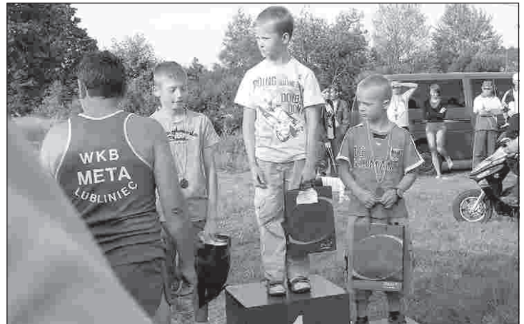
Zwycięzcy w grupie wiekowej najmłodszych uczestników