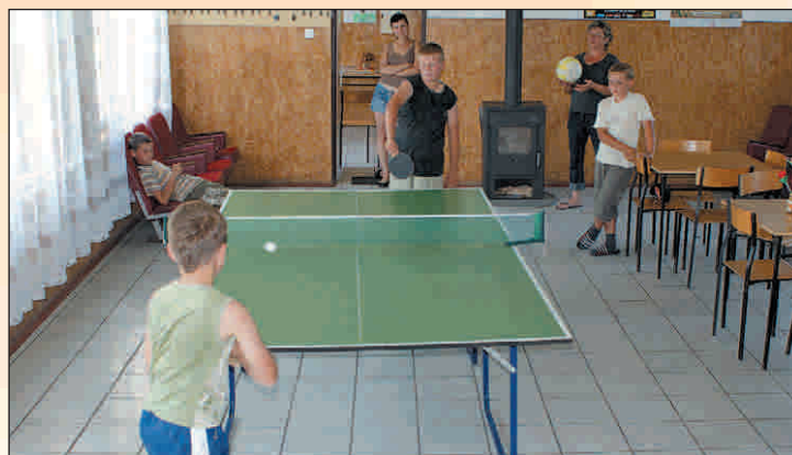
W świetlicy w Krajowie mistrzów tenisa stołowego nie brakuje