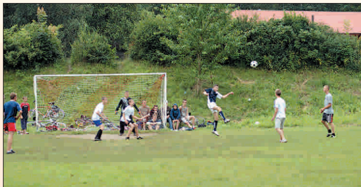
Turniej piłki nożnej w Toporni