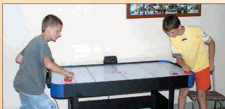
Gdy pogoda nie dopisuje, w świetlicy w Skrzyńsku czas mija przyjemnie