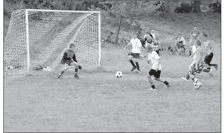
SKS Smogorzów w ataku na bramkę UKS Biedronka

Jagodzianka Team - FC 2:12 Korona Skrzyńsko - Krakowska Street 2:3 Jagodzianka Team - Krakowska Street 3:3 Korona Skrzyńsko - FC 1:3 Jagodzianka Team - Korona Skrzyńsko 3:0 Krakowska Street - FC 5:7