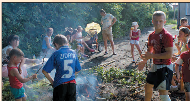
Miło wspólną zabawę zakończyć ogniskiem tak jak w świetlicy w Glińcu