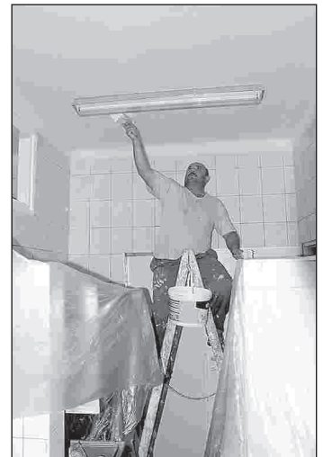
Malowanie sal w Samorządowym Przedszkolu nr 1

Zakres prac: wymiana drzwi wejściowych do przedszkola, cyklino-