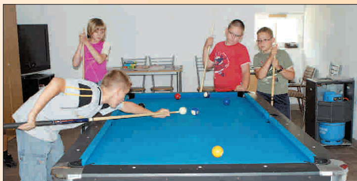
Przy stole bilardowym w świetlicy, w Skrzyńsku emocji nie brakuje