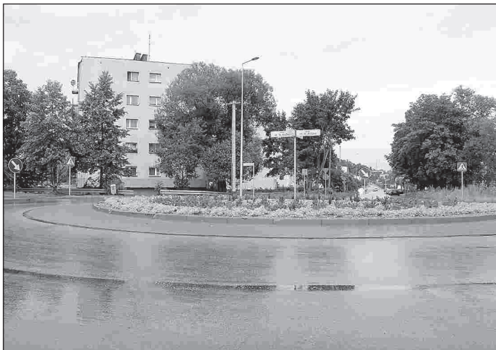
Rondo im. Wincentego Witosa

Wincentego Witosa. Przysuska Służba Komunalna posadziła na nim prawie 400 ozdobnych krze-