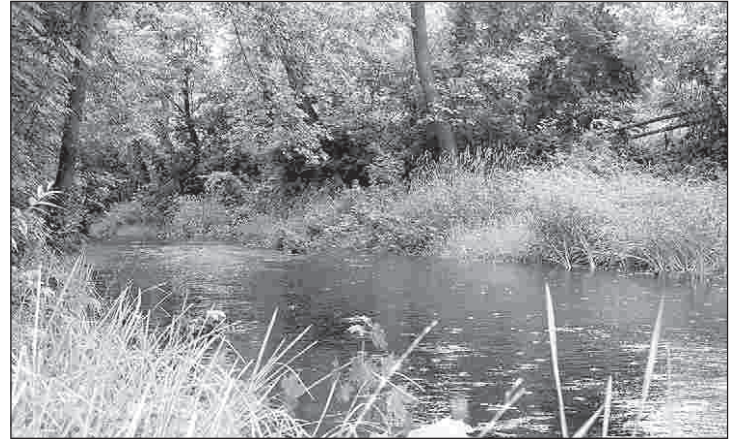
W dolinie Radomki jest wiele pięknych miejsc

LGD „Razem dla Radomki” ma za zadanie inicjować przedsięwzięcia poprzez aktywizowanie wszystkich lokalnych podmiotów publicznych, społecznych i gospodarczych, które dzięki wykorzystaniu środków oferowanych w ramach podejścia Leader przyczynią się do rozwoju społeczno-gospodarczego omawianego obszaru. Ponadto Lo-