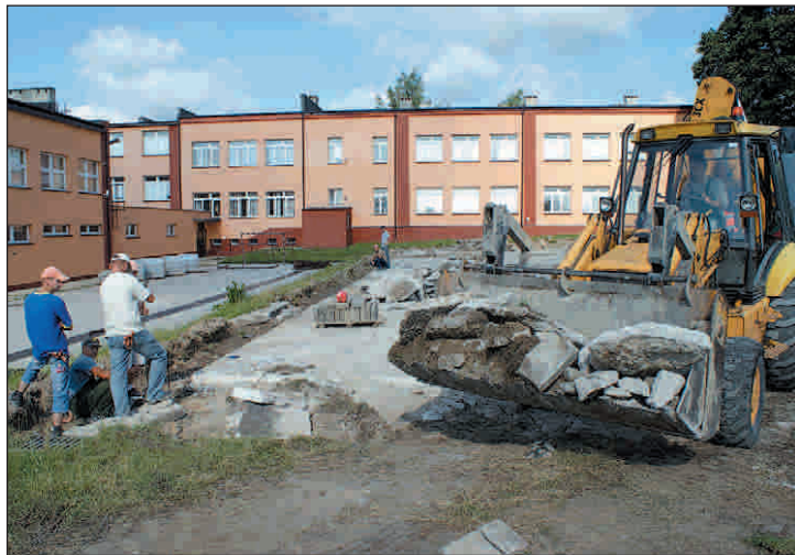
Budowa boiska wielofunkcyjnego przy PSP 1 w Przysusze. Koszt inwestycji 312,6 tys. zł