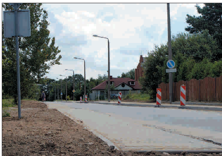
Modernizacja ul. Hubala w Przysusze. Koszt prac 281,5 tys. zł