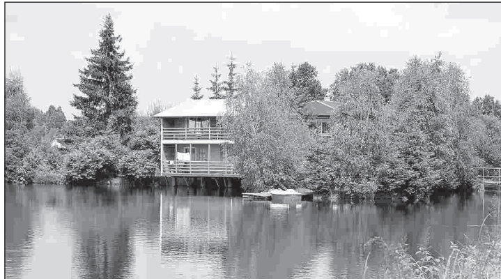
Gospodarstwo Agroturystyczne pp. Czerwińskich

Funkcjonuje od około 10 lat. - Przyjeżdżają do nas całe rodziny -