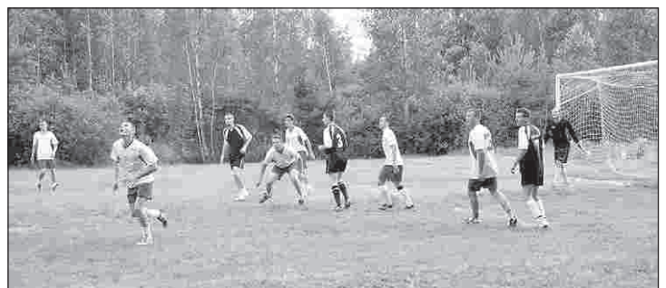
Walka na boisku była ostra