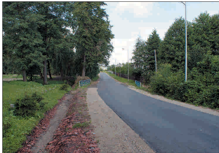
Modernizacja ul. Polnej w Smogorzewie zakończona. Koszt prac 61,5 tys. zł