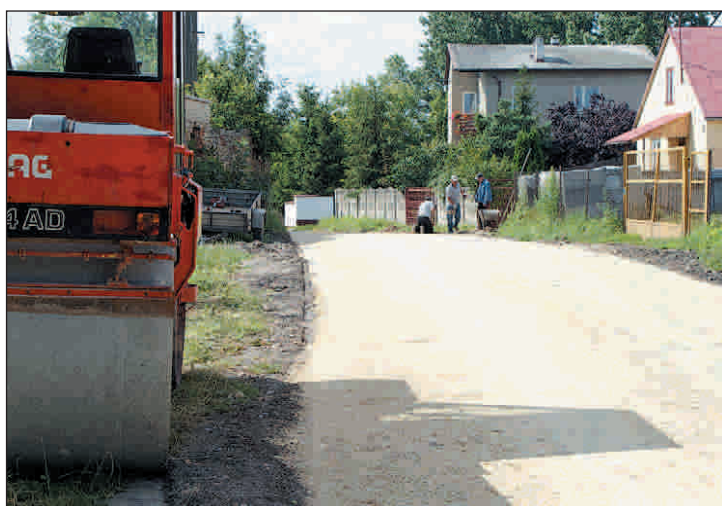
Budowa ul. Leśnej w Skrzyńsku. Koszt prac 169,2 tys. zł