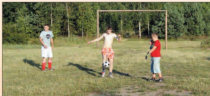
Świetlica w Janowie organizuje wiele rozgrywek piłkarskich