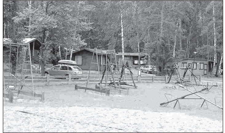
Ośrodek Wypoczynkowy „Krokodyl” cieszy się dużą popularnością od wielu lat

z małymi dziećmi lub, co jest bardzo częstym zjawiskiem, babcie z wnukami. Ale nie brakuje też