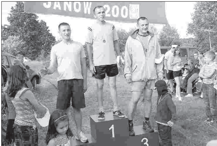
Zwycięzcy w grupie wiekowej starszej na podium