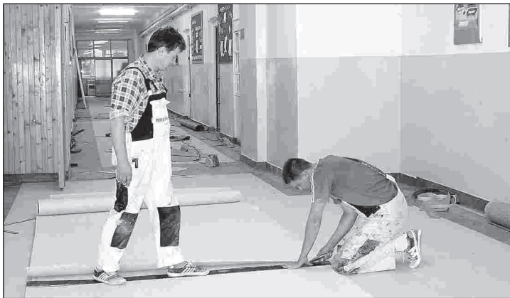
Układanie wykładziny podłogowej na dolnym korytarzu PSP 1

rzchni poliuretanowej grubości 13 mm przepuszczalnej dla wody. Boisko ogrodzone panelami wykonanymi z kątownika i siatki plecionej. Wyposażenie: stojaki do piłki siatkówkowej i koszykowej, bramki do piłki ręcznej.