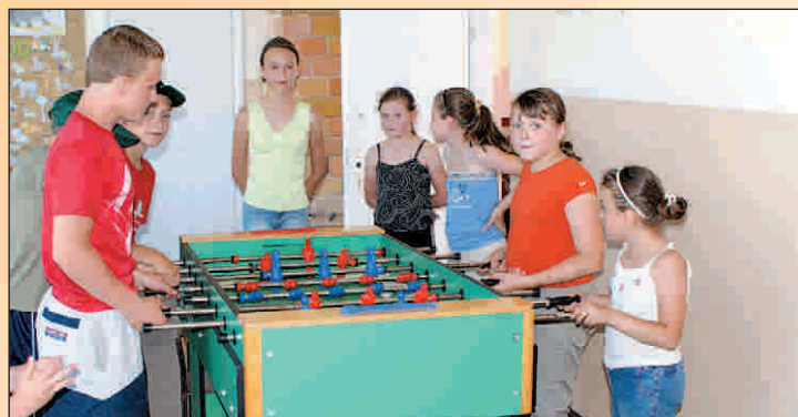
W świetlicy w Glińcu, w „piłkarzyki” grają razem chłopcy i dziewczęta