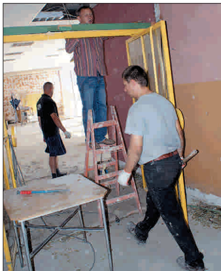
Remont w budynku Domu Kultury w Przysusze trwa. Ogólny koszt robót 260 tys. zł