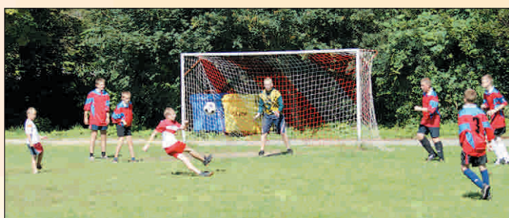
„Maks” strzela na bramkę Smogorzowa