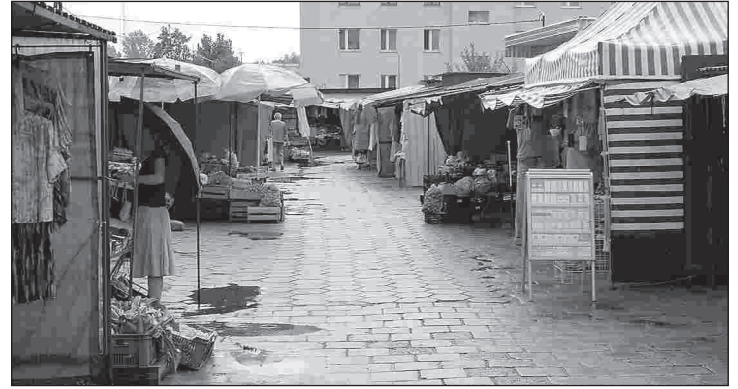
Targowisko miejskie czekają poważne zmiany