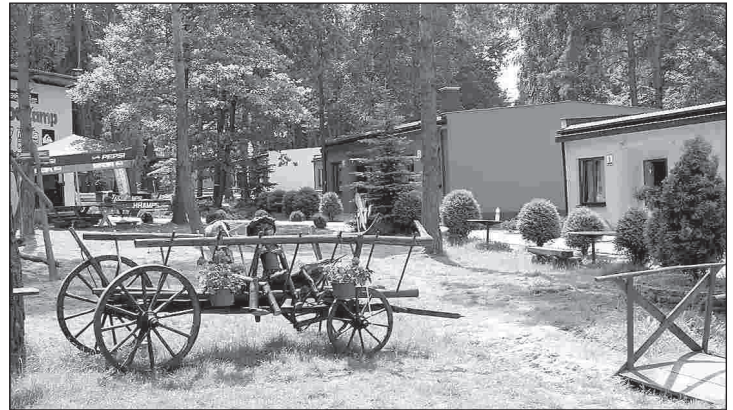
Ośrodek Wypoczynkowy „Marysieńka” posiada nowoczesny skate park

lard, szafa grająca, dyskoteki, koncerty rockowe - to bogata oferta dla spędzających tu urlop gości. „Marysieńka” jest też miejscem organizowania obozów dla miłośników des-