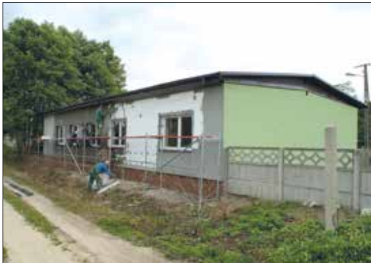
Remont świetlicy wiejskiej w Wistce