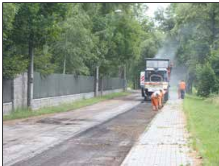
Trwa przebudowa drogi gminnej Zawada – Mariówka

Jeszcze w tym roku, jak informuje Wydział Zagospodarowania Prze-strzennego i Inwestycji możemy się spodziewać ogłoszenia przetargu na wyłonienie wykonawcy zagospodarowania terenu przy ulicy Przemysłowej w Przysusze. W ramach tej inwestycji planuje się wykonanie chodnika dla pieszych, miejsc parkingowych oraz placu zabaw dla