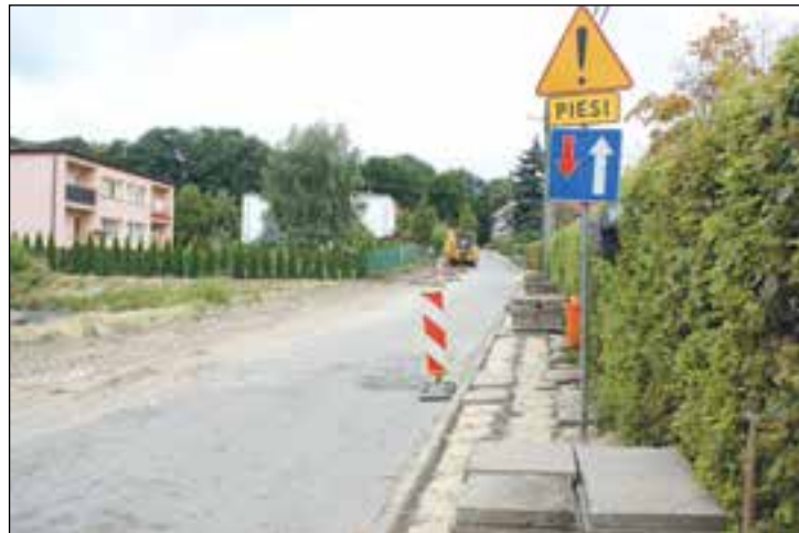
Rozpoczęła się przebudowa alei Jana Pawła II w Przysusze