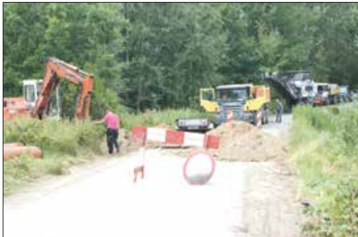
Remontowana droga gminna Lipno – Pomyków