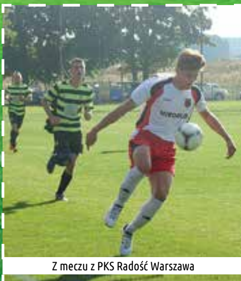
Z meczu z PKS Radość Warszawa