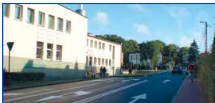
Aleja Jana Pawła II

Budowa hali sportowej – w 2013 roku rozpoczęto budowę pełnowymiarowej sali sportowej przy Publicznym Gimnazjum im. św. Stanisława Kostki w Przysusze. Koszt budowy sali to ponad 4,3 mln zł. Ten nowoczesny obiekt ma być gotowy za rok.