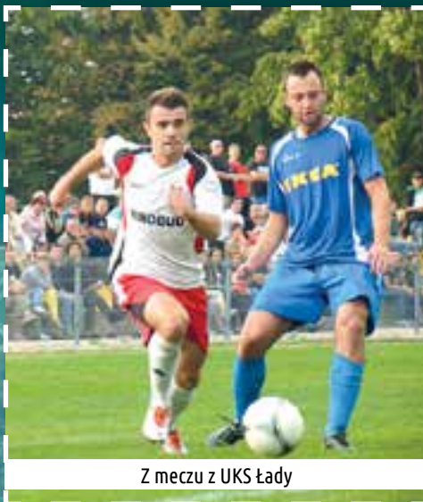
Z meczu z UKS Łądy