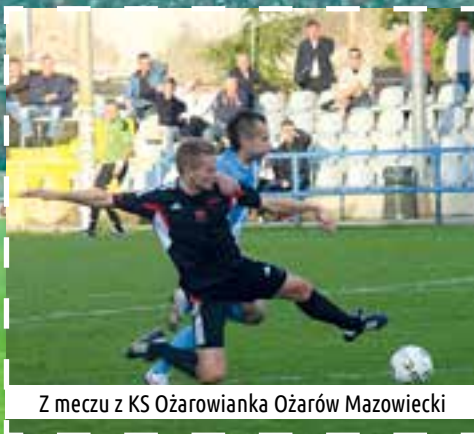
Z meczu z KS Ożarówianka Ożarów Mazowiecki