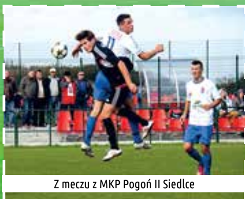
Z meczu z MKP Pogoń II Siedlce