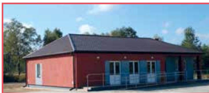
Wiejski Ośrodek Kultury w Kozłowcu