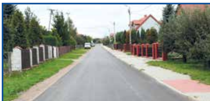
Drogi gminne: Zawada - Mariówka