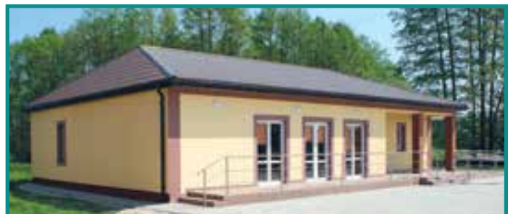
Wiejski Ośrodek Kultury w Woli Więcierzowej

Poprawa wizerunku miasta - centralny punkt Przysuchy: teren dworca autobusowego zmienia swój wygląd na plus. Elewacja budynku dworcowego została odnowiona, a zieleńce uporządkowane. To konsekwencja podjętych decyzji o przekazaniu terenu dworca gminnej spółce PGKiM.