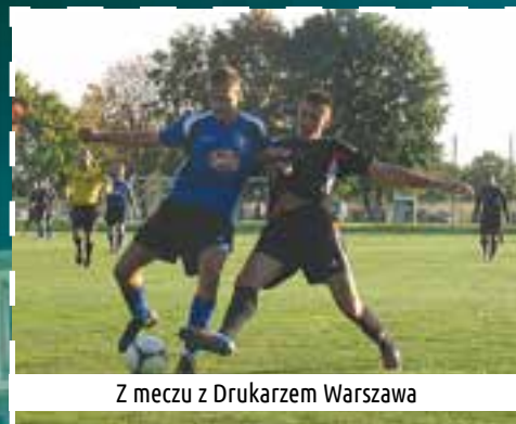
Z meczu z Drukarzem Warszawa