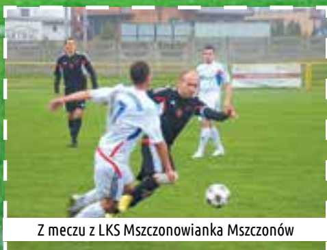
Z meczu z LKS Mszczonowianka Mszczonów