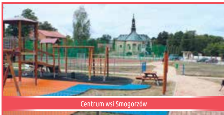
Centrum wsi Smogorzów