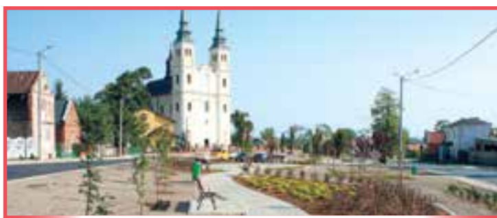
Centrum wsi Skrzyńsko

Poprawa wizerunku miasta - rzeźby związane z postaciami muzyków ludowych ozdobiły kilka centralnych miejsc w Przysusze. Powstały one podczas pleneru rzeźbiarskiego, zorganizowanego w czerwcu 2012 roku przez Dom Kultury. Przedsięwzięcie zostało dofinansowane z funduszy Ministerstwa Kultury i Dziedzictwa Narodowego.