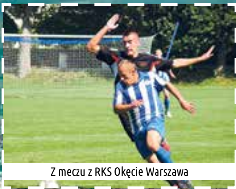
Z meczu z RKS Okęcie Warszawa