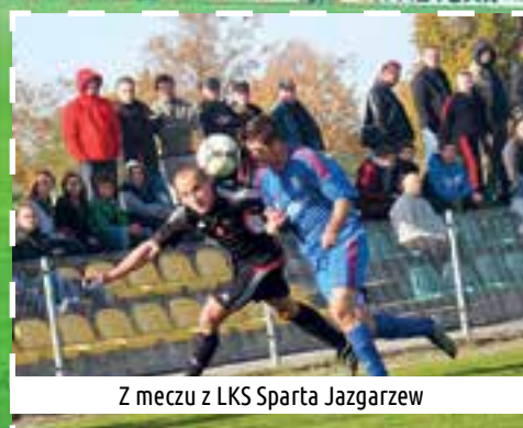
Z meczu z LKS Sparta Jazgarzew