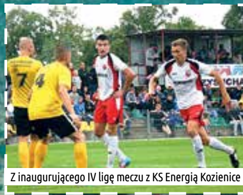
Z inauguracyjnego IV ligowego meczu z KS Energią Kozienice