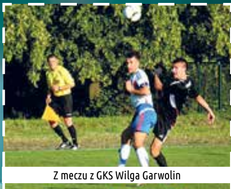
Z meczu z GKS Wilga Garwolin