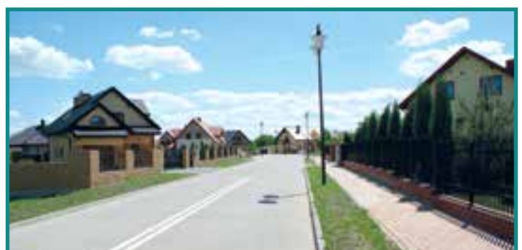
Osiedle Dembińskich w Przysusze