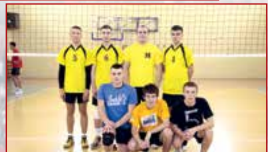
Osiedle Team Przysucha