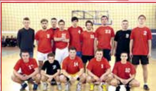
Volley Żelazny Opoczno