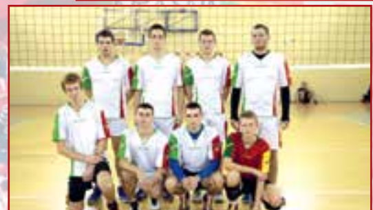
For Fun Volley Przysucha