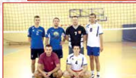
Art.-Kom Szóstka Opoczno