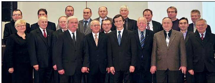
Przedstawiciele gmin, które weszły w skład Stowarzyszenia