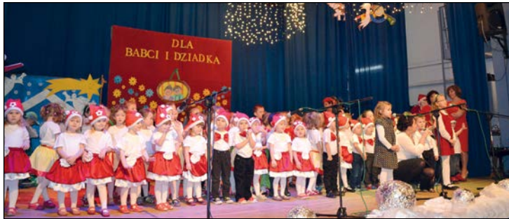
Życzenia dla babć i dziadków złożyły wszystkie przedszkolaki

praszenie babć i dziadków na uroczystość z okazji ich święta jest tradycją na stałe wpisaną w repertuar imprez przedszkolnych. Święto Babci i Dziadka to dzień niezwykły, nie tylko dla dzieci, ale przede wszystkim właśnie dla babć i dziadków. To dzień pełen uśmiechów,