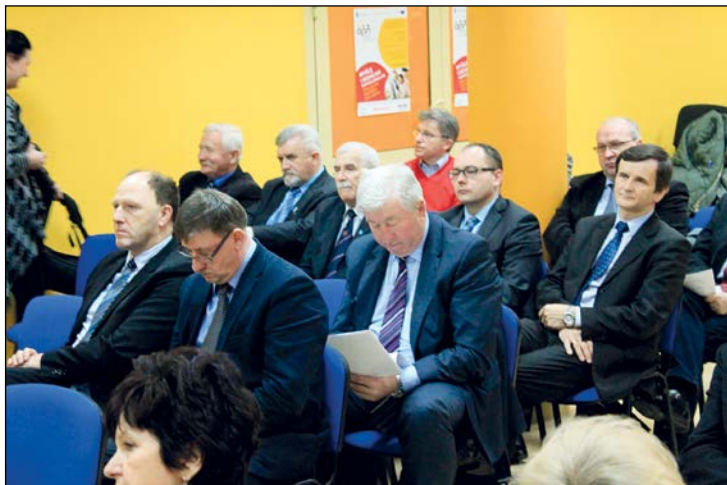
Burmistrz Przysuchy uczestniczył w spotkaniu z Marszałek Ewą Kopacz

W województwie mazowieckim będzie pięć obszarów RIT, w tym jeden dla regionu radomskiego. Do podziału jest 130 mln euro. Jac.