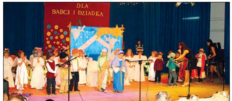
Najstarsza grupa wystawiała jasełka