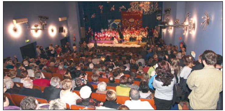
Na koncert przedszkolaków przyszły całe rodziny wzruszeń, łez i radości.