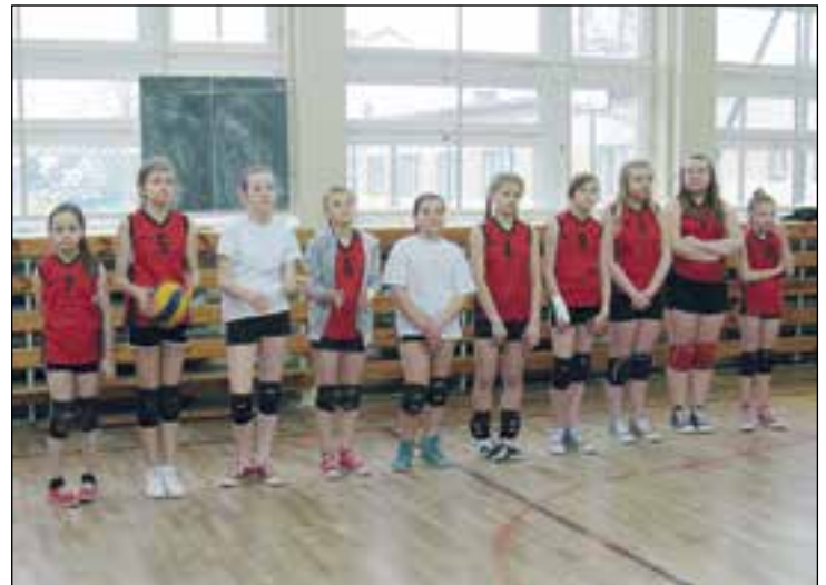
Wicemistrzynie Powiatu z PSP w Skrzyńsku