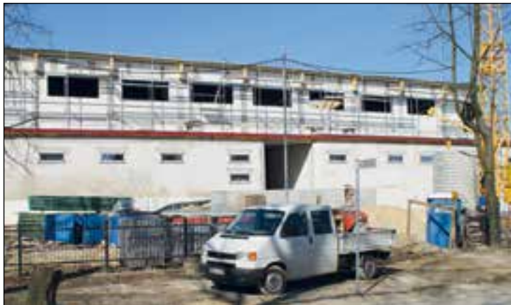
Budowa hali sportowej