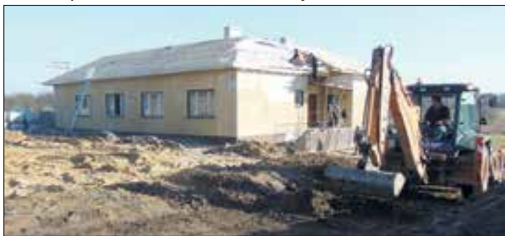
Modernizacja świetlicy w Zbożeniu

Ponadto kontynuowana będzie budowa przydomowych oczyszczalni ścieków na terenie gminy, dobudowa sieci wodno-kanalizacyjnej, budowa rezerwowej studni głębinowej.