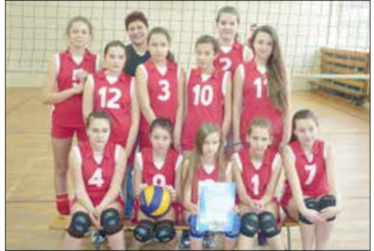
Mistrzynie Powiatu z PSP 2