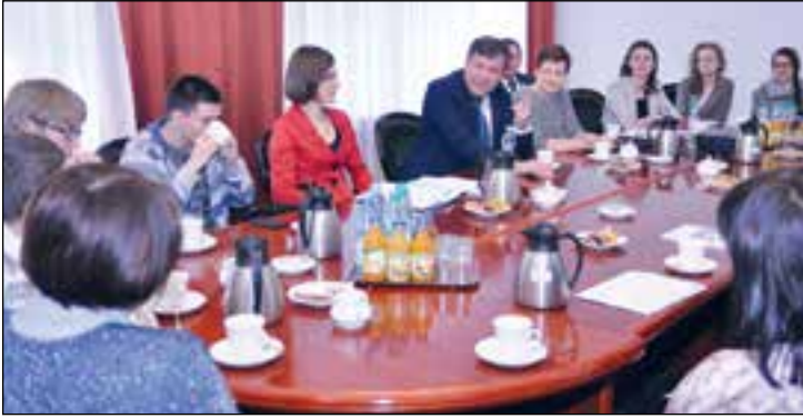
Uczniowie z Mariówki na spotkaniu z ministrem gospodarki, wicepremierem Januszem Piechocińskim.