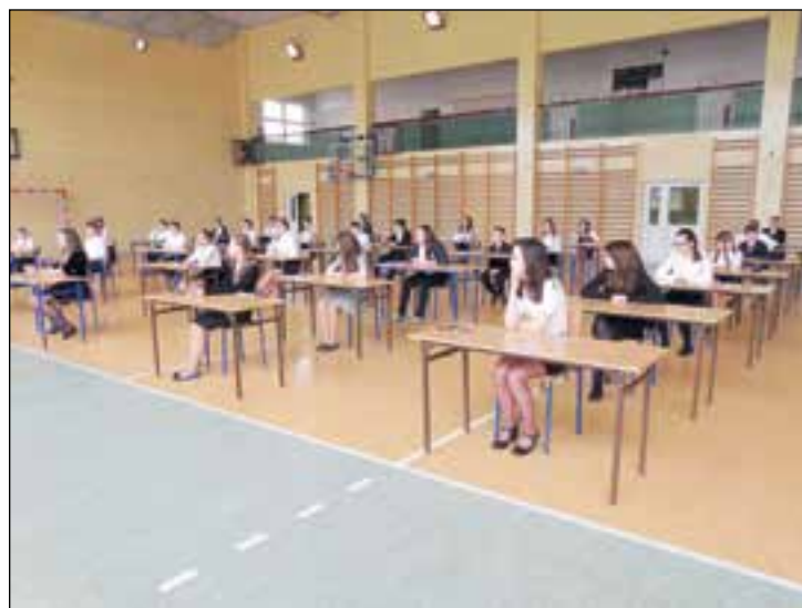
Szóstoklasiści PSP 1 w Przysusze

W PSP NR 1 W PRZYSUSZE: do sprawdzianu szóstoklasisty w Publicznej Szkole Podstawowej nr 1 w Przysusze przystąpiło 41 uczniów. Jak co roku – sprawdzian ten badał poziom umiętności kluczowe w zakresie czytania ze zrozumieniem, pisania, rozumowania, wykorzystania wiedzy w praktyce oraz korzystania z różnych źródeł informacji. Na napisanie 20 zadań zamkniętych i 6 zadań otwartych uczniowie mieli 60 minut. Według większości szóstoklasistów z przysuskiej „Jedynki” zadania nie były trudne, chociaż niektóre wymagały głębszego zastanowienia się. W zadaniach otwartych z języka polskiego uczniowie redagowali ogłoszenie o zbiorce książek na loterię oraz pisali opowiadanie, którego myślą przewodnią było stwierdzenie: „Co dwie głowy, to nie jedna”.