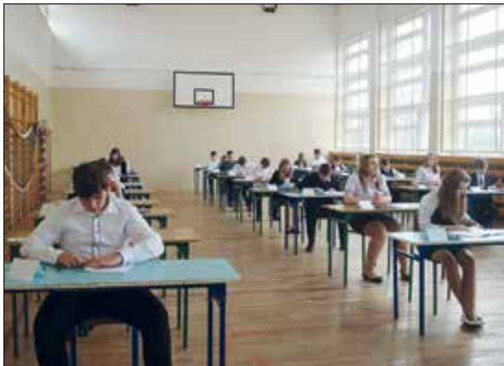
Szóstoklasiści PSP w Skrzyńsku

W PSP W SKRZYŃSKU: to był nietypowy prima aprilis. Nie tylko dla uczniów klas VI PSP w Skrzyńsku, ale w ogóle dla wszystkich szóstoklasistów w kraju. Tego dnia – 1 kwietnia 2014 roku zmierzili się oni ze sprawdzianem kompetencji. Przystąpienie do niego i napisanie jest jednym z warunków ukończenia szkoły podstawowej.