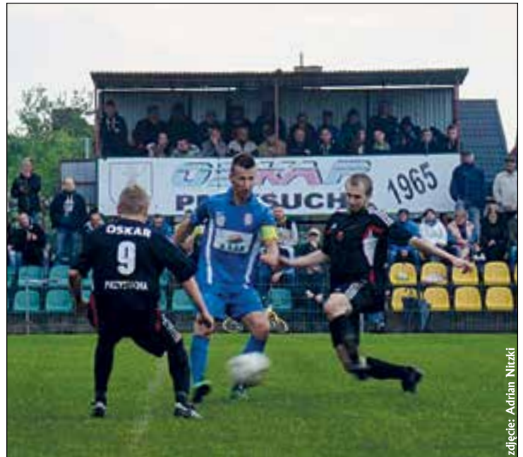
Z meczu z MKP Pogoń II Siedlce