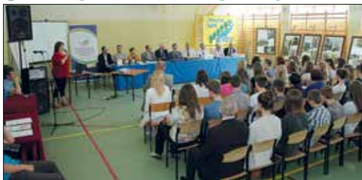
Final konkursu „Pomniki przyrody w dolinie Radomki” odbył się w Publicznym Gimnazjum im. św. Stanisława Kostki w Przysusze

Następnie jury przystąpiło do wręczenia nagród w konkursie fotograficznym, który przebiegał w dwóch kategoriach: szkół i indywidualnie.