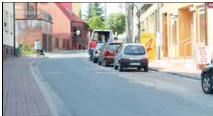
Przebudowana ulica Grodzka w Przysusze

Trwa budowa pełnowymiarowej hali sportowej przy PG w Przysusze. Budynek hali jest już gotowy, trwają prace wewnątrz obiektu. Jest to szandarowa inwestycja w bieżącym roku. Jej wartość to ponad 4,2