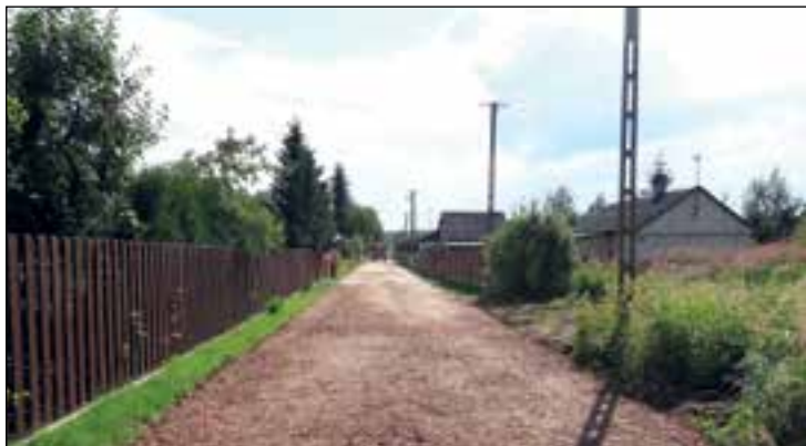
Rozpoczęto przebudowę ulicy Poprzecznej w Ruskim Brodzie

Realizacja zaplanowanych do wykonania w 2014 roku inwestycji drogowych przebiega zgodnie z planem. Mieszkańcy gminy i miasta mogą już korzystać z przebudowanego kompleksu ulic w mieście: Przemysłowa – Lubelska – Grodzka – Chopina . Jest to droga jednopasowa, jednojezdniowa o łącznej długości prawie 700 m. Nawierzchnia ulic została wyrównana i pokryta warstwą ścieralną. Wykonano regulację studzienek kanalizacyjnych, zaworów wodociągowych i telekomunikacyjnych, przebudowano zatoki postojowe przy ulicach Grodzkiej i Chopina, przebudowano skrzyżowanie Chopina – Lubelska – Przemysłowa.