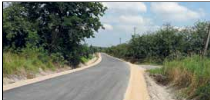
Zakończono prace budowlane na drodze gminnej Smogorzów – Gaj