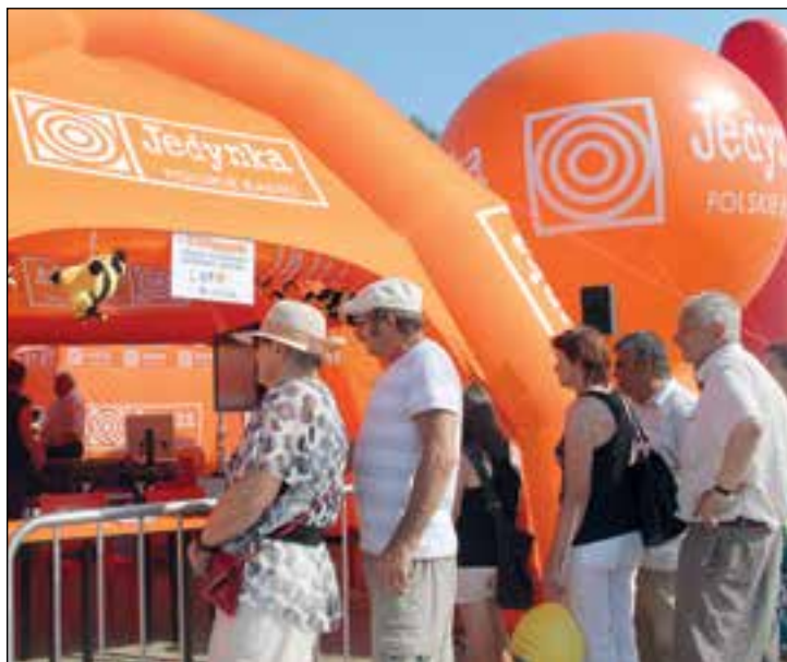
Namiot „Lata z Radiem” odwiedzało wiele osób

ułożyć można jedną z sześciu europejskich ilustracji. Miłośnicy gier mogli zagrać w popularne w różnych krajach UE gry, takie jak: Tafelkegelspel, czyli pochodzące z Niderlandów kręgle stołowe, tradycyjne francuskie pétanque, czyli bule. Dla fanów nowoczesnych technologii zostało zorganizowane stanowisko warsztatowe druku 3D, prezentujące działanie drukarek 3D oraz doodlerów (długopisów 3D). Niecodzienne pamiątki zapewnił kącik fotograficzny, w którym można było otrzymać swoje zdjęcie, wykonane na miejscu, na tle brukselskiej siedziby Komisji Europejskiej – budynku „Berlaymont”. Informacyjno – edukacyjna akcja w Przysusze to część akcji EuroLato 2014, w ramach której namiot Komisji Europejskiej towarzyszy koncertom Lata z Radiem. Jak niezwykle atrakcyjną ofertę zapewnia, potwierdza fakt, że w Przysusze był oblegany przez tłumy odwiedzających.