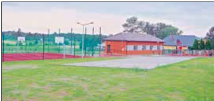
Rozbudowana i zmodernizowana świetlica w Zbożenniu i jej otoczenie

Łączna wartość inwestycji w 2014 roku to blisko 10 mln zł.