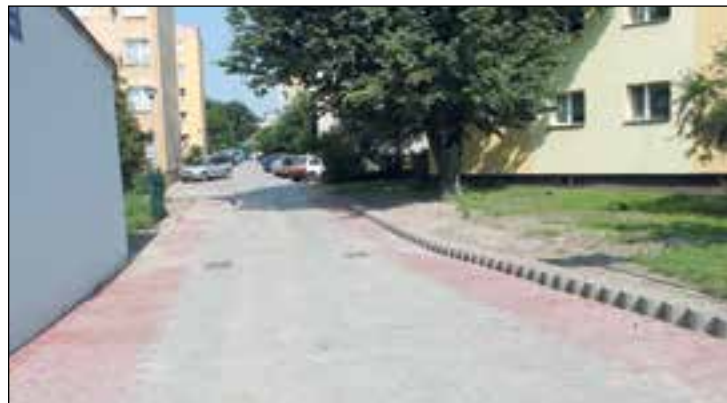
Przebudowana droga wewnętrzna na Osiedlu przy ul. Radomskiej w Przysusze

Zakończono prace projektowe wraz z wymaganymi uzgodnieniami na