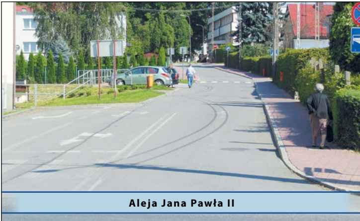
Aleja Jana Pawła II