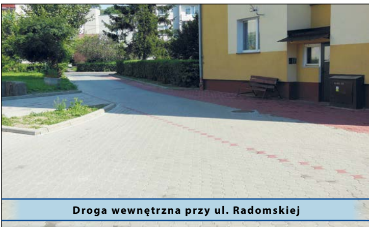
Droga wewnętrzna przy ul. Radomskiej