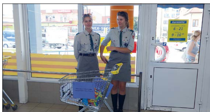
Harcerze zorganizowali zbiórkę artykułów szkolnych dla potrzebujących uczniów