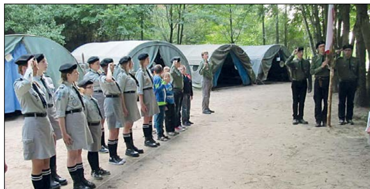
Przysuscy harcerze na obozie w miejscowości Gorzewo – 07/08 2014