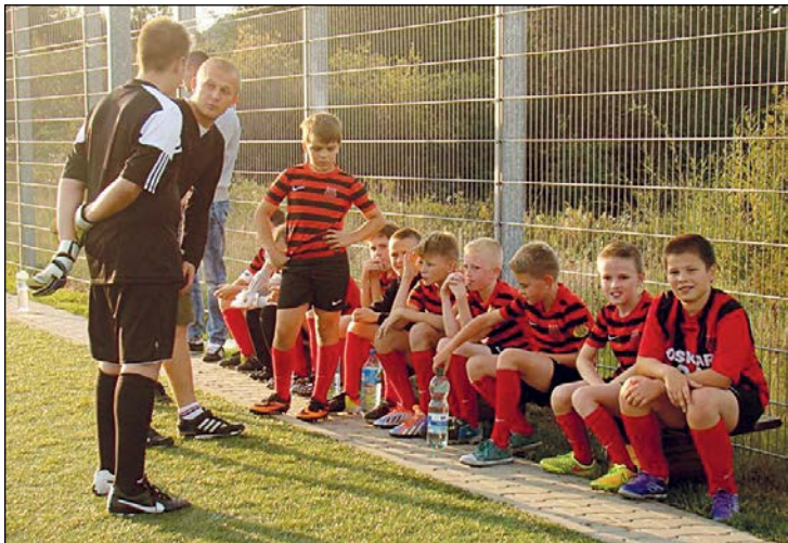
Zespół orlików