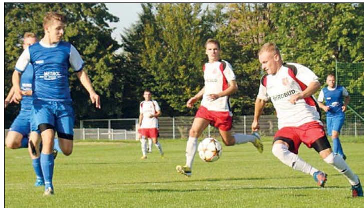
Z meczu MKS Oskar – Zwolenianka Zwolen

W październiku przysuskich piłkarzy czekają mecze z RKS Okęcie W-wa, KS Konstancin, MKS Szydłowiec, GKS Mazowsze Grójec i LKS Sparta Jazgarzew. Trzymamy kciuki!