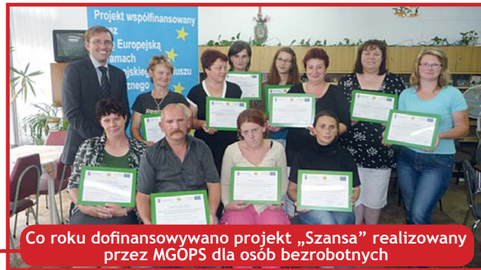
Co roku dofinansowywano projekt „Szansa” realizowany przez MGOPS dla osób bezrobotnych