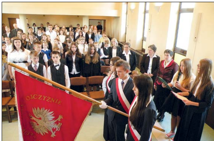
Akt ślubowania gimnazjalistów i licealistów

Uczniowie mieli też sposobność sprawdzenia swojej wiedzy rozwiązując, pod okiem wychowawców, test poświęcony osobie św. Królowej Jadwigi. Najmłodszy uczniowie próbowali swych sił w konkursie rysunkowym. Gimnazjaliści i licealiści z radością oficjalnie przyjęli do wspólnoty szkolnej swe młodsze koleżanki i kolegów oraz wręczyli im drobne upominki.