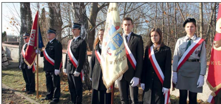
W święcie Niepodległości uczestniczyły poczty sztandarowe