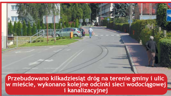
Przebudowano kilkadziesiąt dróg na terenie gminy i ulic w mieście, wykonano kolejne odcinki sieci wodociągowej i kanalizacyjnej