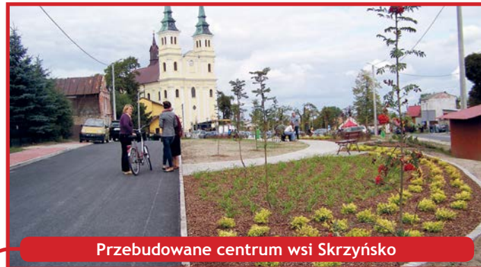
Przebudowane centrum wsi Skrzyńsko