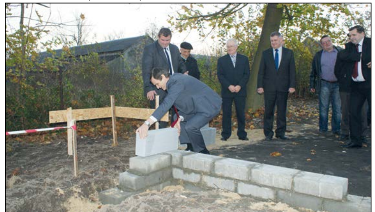
Pierwszą cegłę pod budowę budynku pomocniczego przy świetlicy położył Burmistrz Tadeusz Tomasik