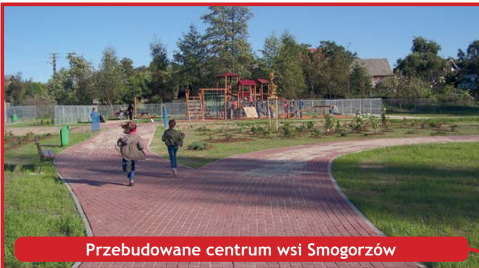
Przebudowane centrum wsi Smogorzów