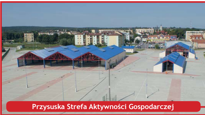
Przysuska Strefa Aktywności Gospodarczej