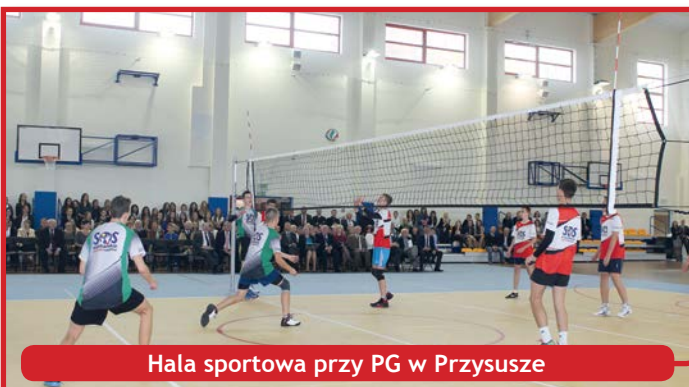
Hala sportowa przy PG w Przysusze