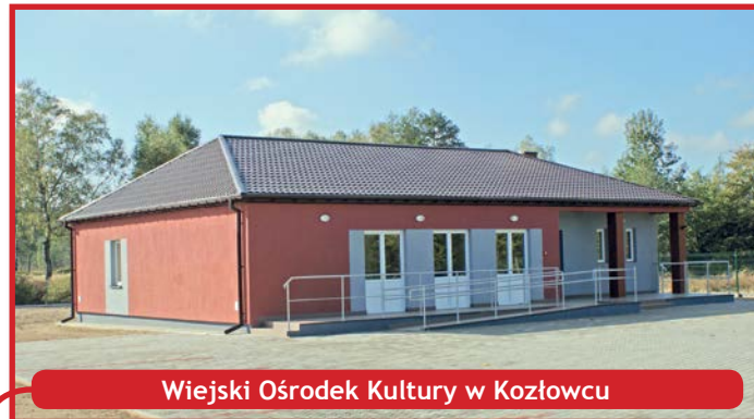
Wiejski Ośrodek Kultury w Kozłowcu