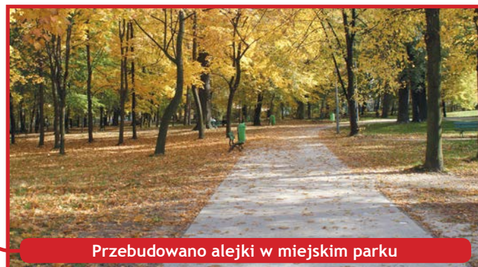
Przebudowano alejki w miejskim parku