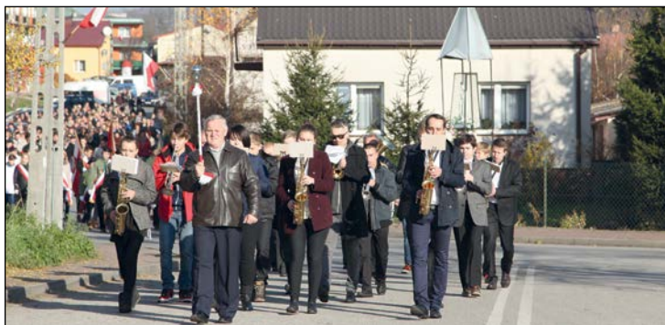
Uczestnicy uroczystości przemaszerowali ulicami Przysuchy

Święto Niepodległości uczczono także we wszystkich przysuskich placówkach oświatowych. W szkołach i przedszkolach odbyły się uroczyste akademie i apele, uatrakcyjnione tematycznym wierszem i piosenką.