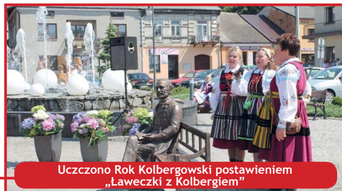
Uczczono Rok Kolbergowski postawieniem „Ławeczki z Kolbergiem”