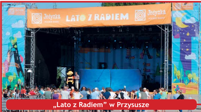
„Lato z Radiem” w Przysusze