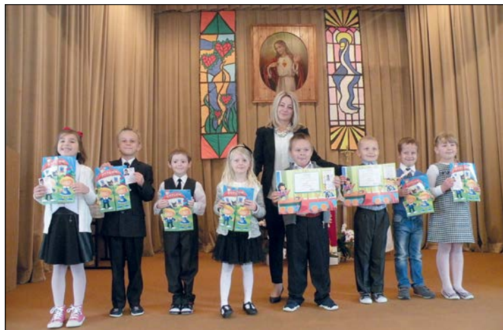
Uczniowie klasy pierwszej po ślubowaniu