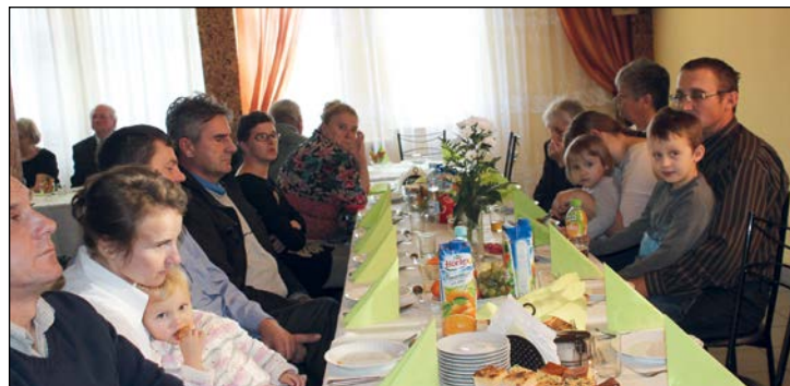
Członkom koła towarzyszyły rodziny