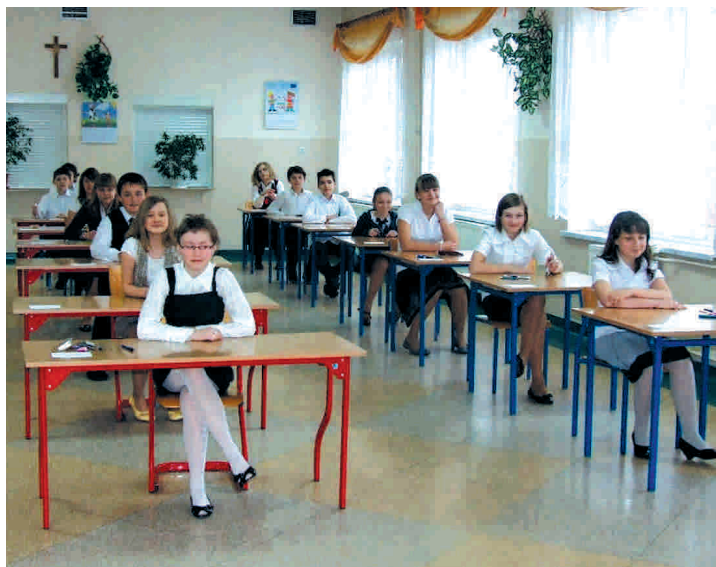
Uczniowie szóstych klas PSP 2 w Przysusze w oczekiwaniu na rozpoczęcie sprawdzianu

- Czy będzie równie dobrze jak w ubiegłych latach, czy może jeszcze lepiej? - to pytanie zadają sobie uczniowie, nauczyciele i rodzice. W Publicznej Szkole Pod-