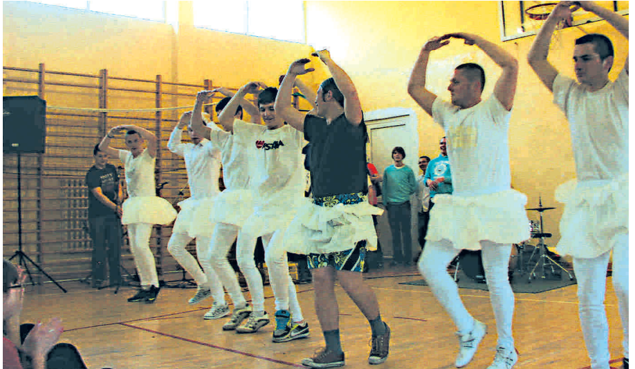
Program kabaretowy przygotowany przez chłopców.

poetyckich, ale najbardziej intrygującym punktem programu okazał się taniec w wykonaniu młodzieży płci męskiej. Panowie - ku uciesze zgromadzonych widzów - zaprezentowali fragment "Jeziora łabędziego".