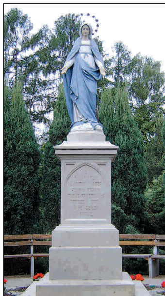
Kapliczka w Mariówce