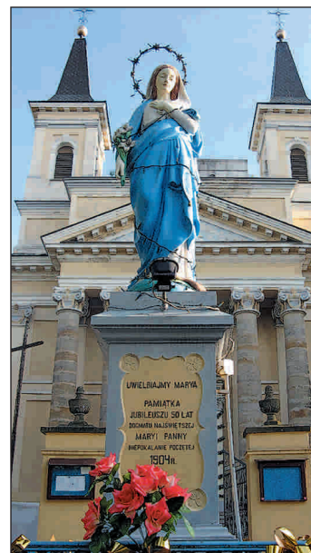
Kapliczka w Przysusze