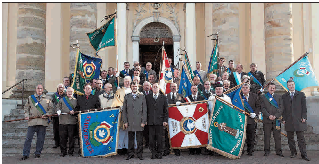
Pamiątkowe zdjęcie przed kościołem pw. Św. Jana Nepomucena

Kilkaset osób uczestniczyło w sobotę 17 kwietnia w uroczystości poświęcenia sztandaru oddziału Polskiego Związku Hodowców Gołębi Poczтовых w Przysusze. Uroczystość zorganizowana w kościele pw. św. Jana Nepomucena była jednocześnie otwarciem sezonu lotowego kieleckiego okręgu PZHGP.