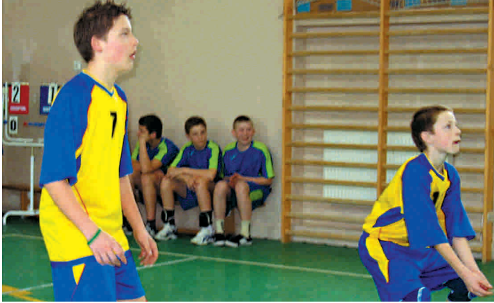
Chłopcy walczyli z zacięciem.

18 i 22 marca w Publicznej Szkole Podstawowej Nr 2, w Przysusze zorganizowane zostały półfinały międzypowiatowe w mini piłce siatkowej dziewcząt i chłopców. 19 marca swój półfinał rozegrały dziewczęta z PSP nr 2 w Przysusze.