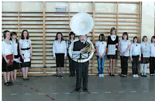
Uczniowie PSP 1 w Przysusze uczcili pamięć ofiar katastrofy uroczystym apelem.

się w milczącym pochodzie do kościoła na mszę świętą, by pomodlić się za dusze ofiar katastrofy. W szkole nauczyciele przygotowali tablicę upamiętniającą tragicznie zmarłych. Przyniesienie również postanowili złożyć hołd wszystkim tragicznie zmarłym. W czwartek 15 kwietnia z Zespołu Szkół nr 1 im.