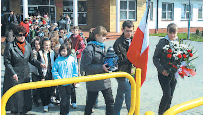
Uczniowie PSP 2 w Przysusze, w "milczącym przemarszu".

ki na temat tragicznych wydarzeń. Rozmawiano również o zbrodni dokonanej w Katyniu, w czasie II wojny światowej, by uczniowie mogli zrozumieć istotę tragicznie zakończonej podróży oficjalnej delegacji RP do Katynia. We wtorek 13 kwietnia cała społeczność szkolna udała