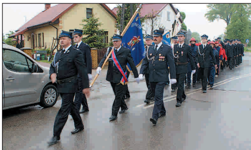
Przemarsz strażaków OSP

Tegoroczne przysuskie, miejsko-gminne obchody Dnia Strażaka odbyły się 16 maja w Skrzyńsku. Kilka dni wcześniej poprzedziły je obchody powiatowe.