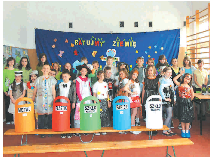
Uczniowie klasy III a, V a i V b PSP nr 1 w Przysusze przygotowali prezentację ekologiczną