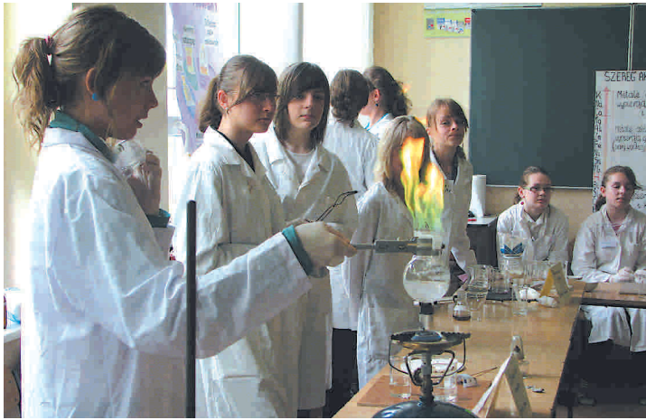
Zajęcia w pracowni chemicznej

W środę 12 maja, w Publicznym Gimnazjum w Przysusze odbył się VII Festiwal Nauki. Był on połączony z dniem otwartym szkoły.