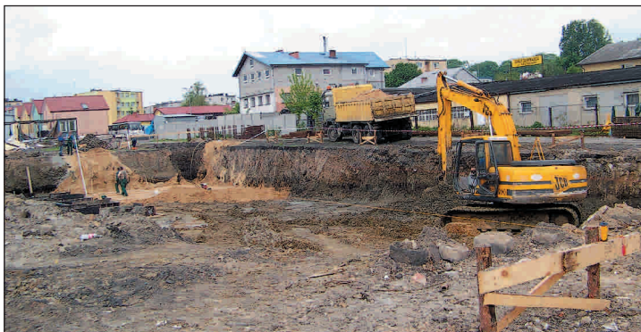
Prace przy budowie strefy gospodarczej są w pełnym toku

go i to co najważniejsze - nowoczesne hale targowe - mają być gotowe do końca listopada br. Prace, jak informuje Urząd Gminy i Miasta, przebiegają zgodnie z założonym harmonogramem. Na czas realizacji inwestycji, część stanowisk targowych przeniesiono