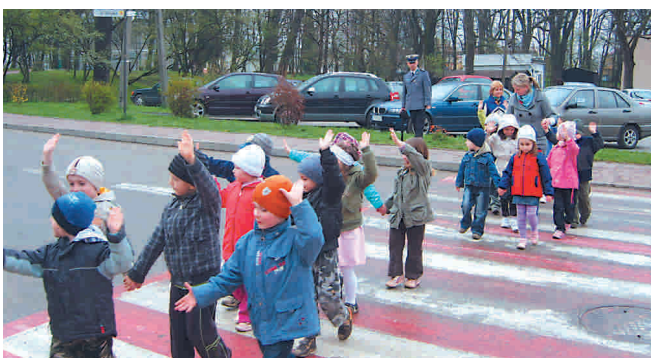
Przedszkolaki podczas praktycznej lekcji bezpiecznego poruszania się na ulicy