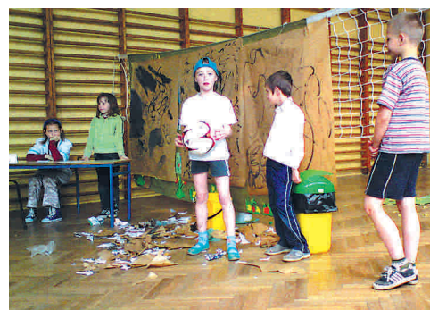
Uczniowie PSP w Ruskim Brodzie przygotowali program ekologiczny

Publiczna Szkoła Podstawowa im. Hubalczyków w Ruskim Brodzie w sposób szczególny uczciła obchody Dnia Ziemi w Polsce. 22 kwietnia uczniowie kl. II programem ekologicznym zachęcaли całą społeczność szkolną do dbania o ład i porządek. Aby obraz Ziemi nie był bury i ponury "Hubalczycy" proponują zdrową modę pod hasłem: "Nie ważne czy jesteś duży, czy mały, dbaj o swoje otoczenie".