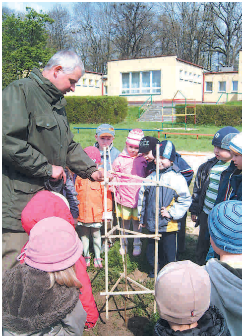
Wspólne sadzenie drzewka

Najmłodszy mieszkańcy Przysuchy, przedszkolaki z Samorządowego Przedszkola Nr 1 uroczysto obchodzili Dzień Ziemi.