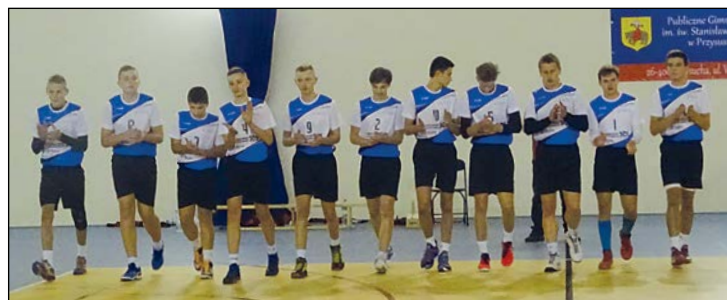
Na zdjęciu zespół Publicznego Gimnazjum w Przysusze

sadniczej pozostało cztery kolejki. Przypominamy, że do półfinałów awansują cztery najlepsze drużyny po rundzie zasadniczej. Najbliższa kolejka zostanie rozegrana 30 stycznia br., mecze rozgrywane są w hali sportowej PG w Przysusze. Serdecznie zapraszamy.