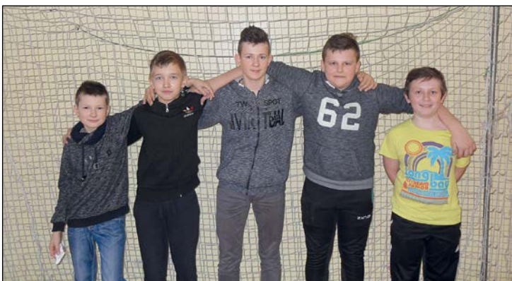
Zwycięska drużyna chłopców