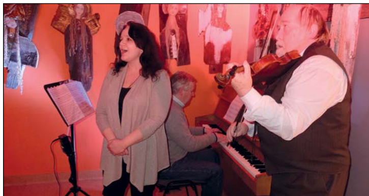
Dodatkowy klimat stworzyła oprawa muzyczna