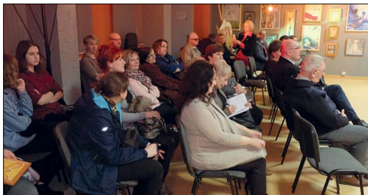
Uczestnicy wernisażu z zainteresowaniem słuchali informacji o wystawie