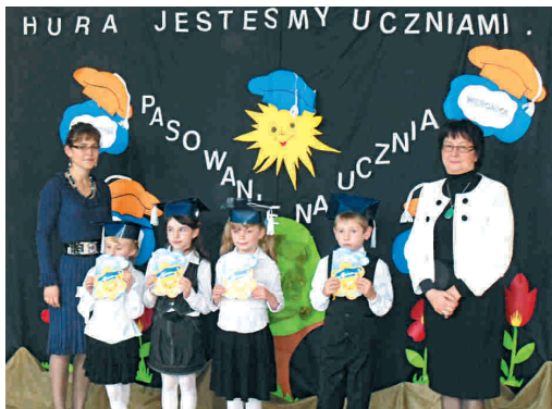
Pierwszaki w towarzystwie swojej Pani i dyrektorki szkoły

Na zakończenie nauczyciele i pracownicy szkoły przyjęli życzenia oraz kwiaty z okazji święta wszystkich pracowników oświaty.