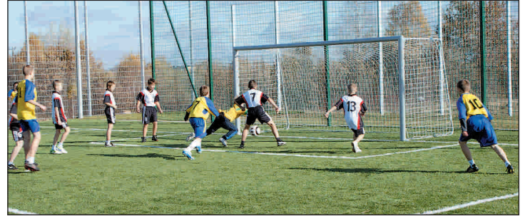
Inauguracyjny mecz na Orliku w Przysusze

wki tegorocznego turnieju Orlików składały się z czterech etapów (eliminacje gminne, wojewódzkie, finały wojewódzkie i finał ogólnopolski) i trwały od września do października.