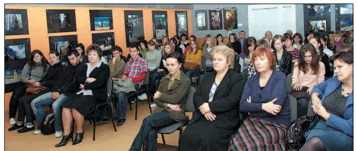
Uczestnicy spotkania z autorem

wnież o trudnym życiu Polaków mieszkających w Kazachstanie oraz o swojej drodze do lepszego życia. Ponadto zaprezentował swoją twórczość, odczytał m.in. wybrany fragment opowiadania z tomiku „Nadchodzi wieczór - 2”.