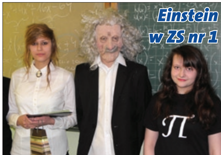
Uczniowie ZS nr 1 w rolach M. Curie-Skłodowskiej, A. Einsteina i liczby Pi