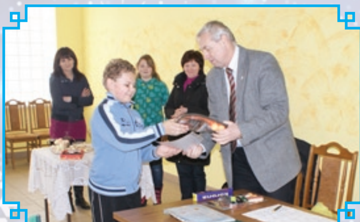
Zwycięzcy turniejów i konkursów byli nagradzani