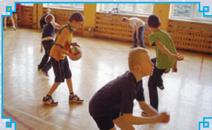
W Mariówce ferie na sportowo