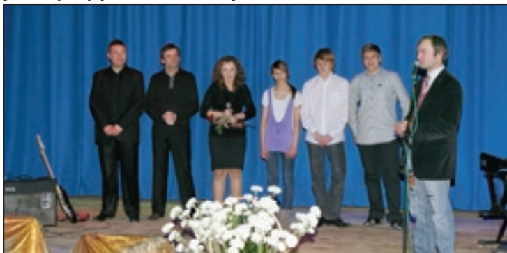
Wykonawcy koncertu z okazji Dnia Kobiet