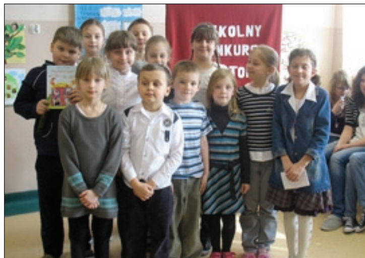
Uczestnicy szkolnego konkursu recytatorskiego w PSP 2

Przedszkolny konkurs ma na celu rozwijanie zdolności recytatorskich, zamiłowań i zainteresowań twórczością literacką, która w efekcie bogaci wewnątrz i wpływa na wszech-