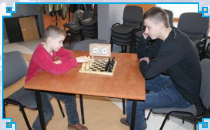
Gra w szachy wymagała skupienia