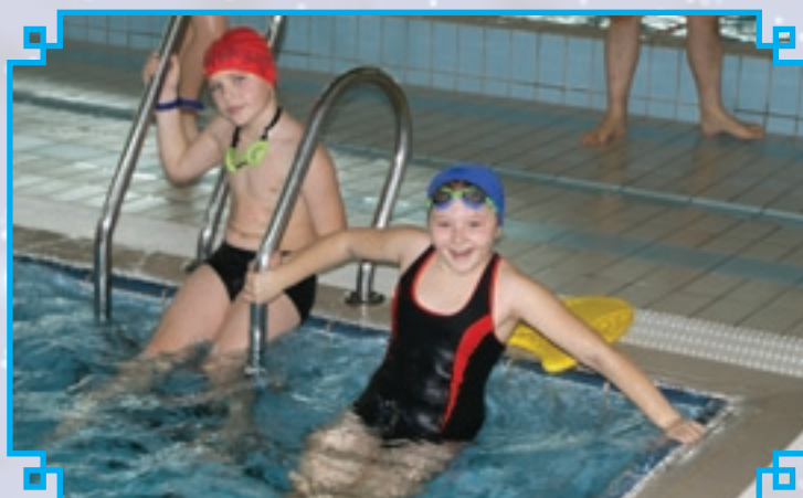
Wycieczki na krytą pływalnię cieszyły się dużym zainteresowaniem