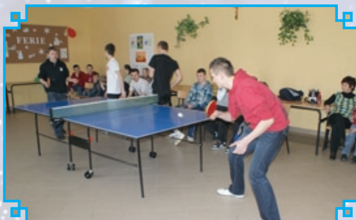
W świetlicach na terenie gminy wolny czas spędzano chętnie grając w tenisa stołowego