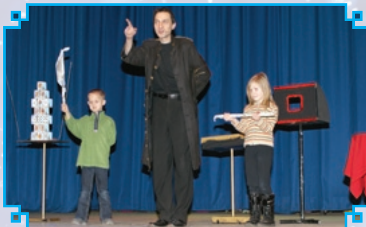
Z iluzjonistą było wesoło i ciekawie