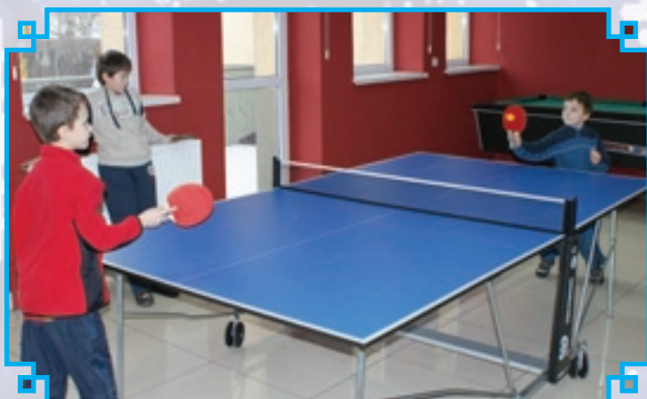
Turnieje tenisa stołowego w Domu Kultury