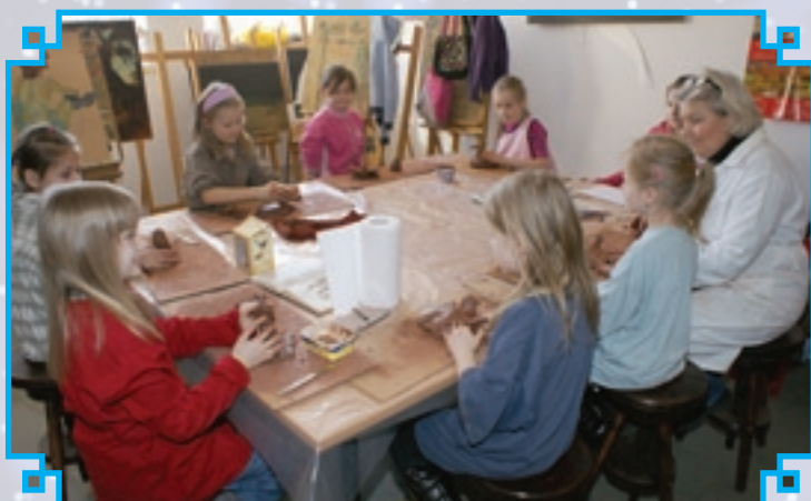
Na zajęciach plastycznych powstawały piękne rzeźby