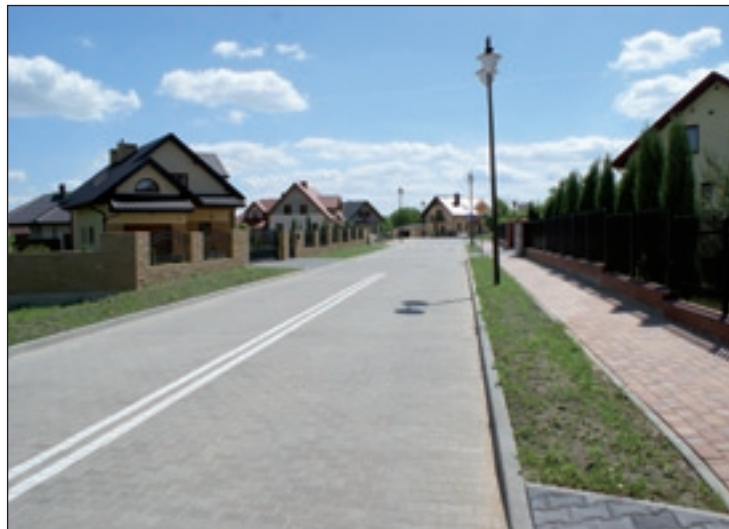
Na osiedlu Dembińskich zakończono budowę ulic