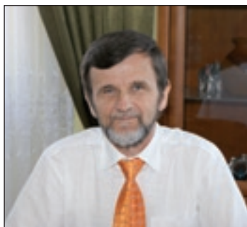
Tadeusz Tomasiak Burmistrz Gminy i Miasta Przysucha

- Będę w tym względzie być może oryginalny, ponieważ nie włączę się do chóru samorządowców, którzy podnoszą larum, że planowane decyzje ministra finansów w sprawie zmniejszania przez samorządy deficytu: w 2012 r. do 4 procent dochodów, w 2013 do 3 procent, w 2014 do 2 procent., a w 2015 do