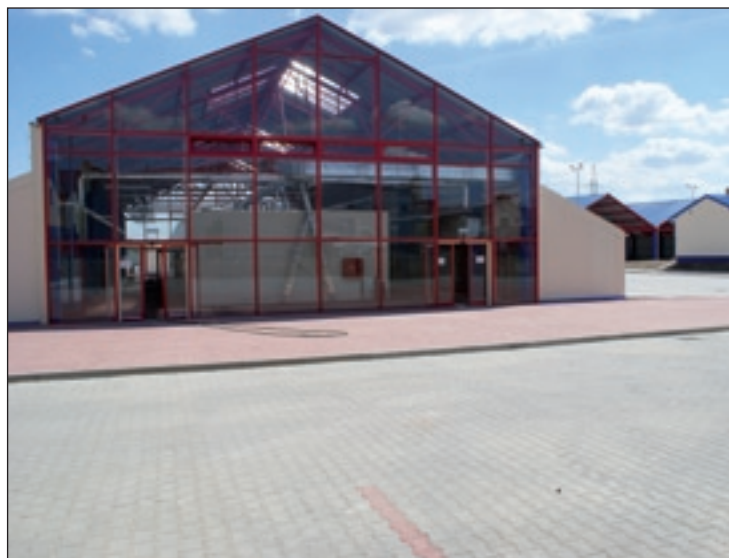
Strefa aktywności gospodarczej już wybudowana