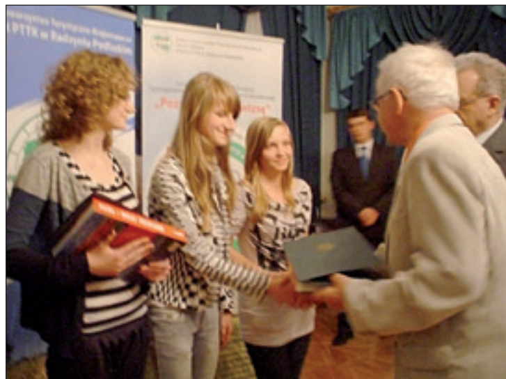
Wręczenie nagród laureatom konkursu krajoznawczego