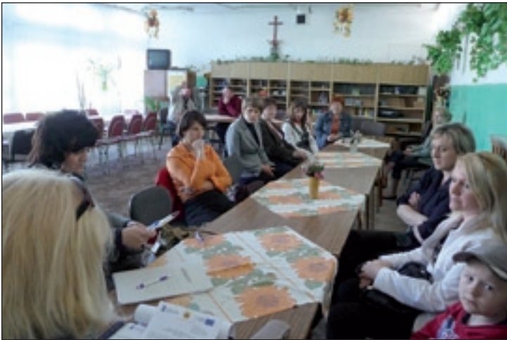
Spotkanie informacyjne z beneficjentami projektu

1 czerwca 2011r. odbyło się pierwsze spotkanie uczestników projektu z doradcą zawodowym, na którym beneficjenci stworzyli bilans dotychczasowych kompetencji oraz zapoznali się z zasadami przygotowania dokumentów dla pracodawcy.