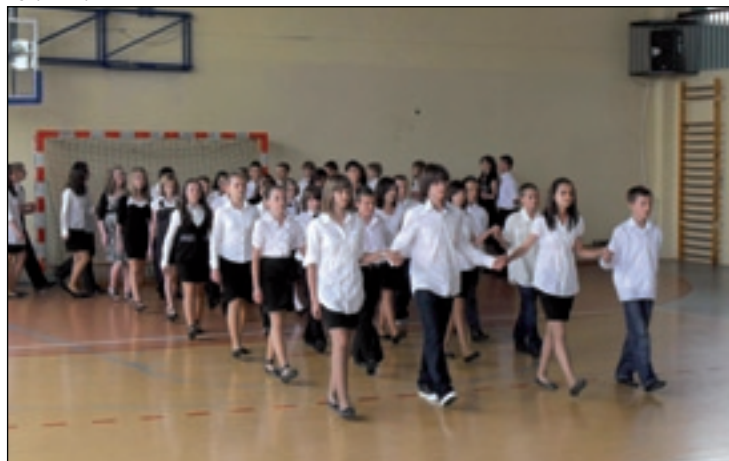
Uczniowie PSP 1 w Przysusze zakończyli rok szkolny polonezem.