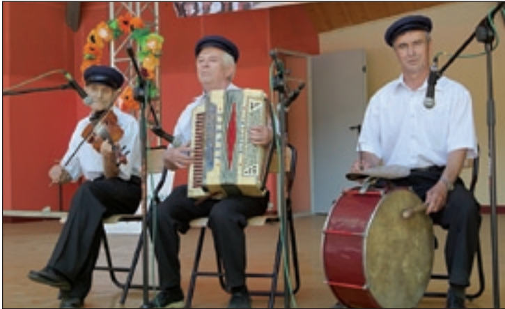
Kapela Pańczaków i Gacy z Przysławowic Małych

W dniach 24 - 26 czerwca br., w Kazimierzu Dolnym nad Wisłą, odbył się 45. Ogólnopolski Festiwal Kapel i Śpiewaków Ludowych. Uczestnikami festiwalu byli także laureaci 52. Dni Kolberowskich. Główną nagrodę „BASZTĘ” w kategorii kapel