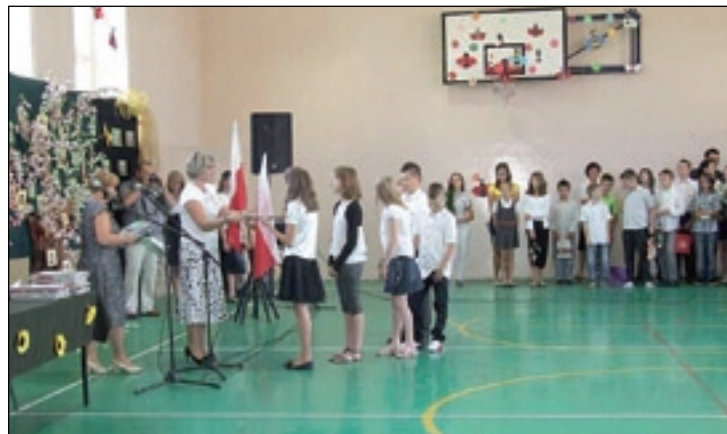
Moment wręczania świadectw uczniom PSP 2 w Przysusze