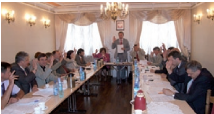
Radni głosowali za absolutorium