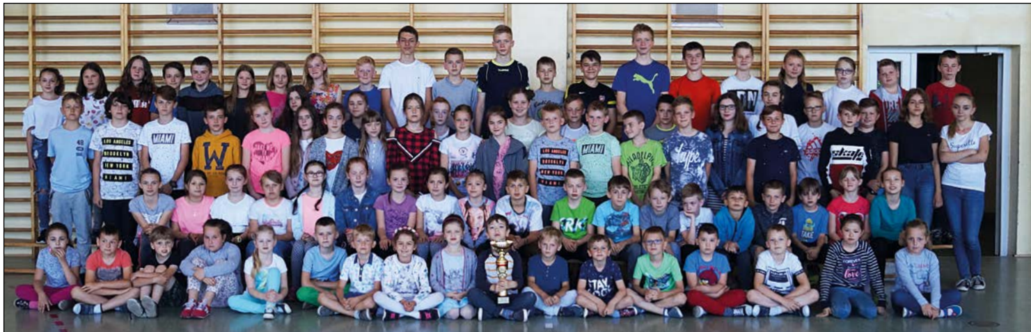
Zwycięscy biegacze z „Jedynki”. Uczniowie PSP 1 po raz czwarty zajęli I miejsce w drużynowej klasyfikacji szkół, w Biegu „Szlakiem Walk Hubalczyków”.