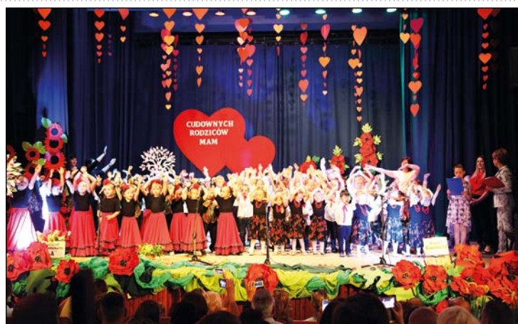
Galeria zdjęć z koncertów na www.pedekprzysucha.pl