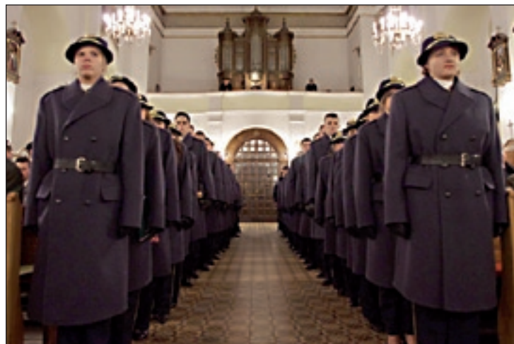
Uczniowie LAKK podczas uroczystej mszy świętej

29 listopada uczniowie Liceum Akademickiego Korpusu Kadetów im. biskupa polowego Wojska Polskiego gen. broni Tadeusza Płoskiego w Lipinach uczcili 181 rocznicę powstania listopadowego. Uroczystości rozpoczęto mszą św. w intencji ojczyzny, celebrowaną przez dziekana dekanatu przysuskiego ks. kan. Andrzeja Szewczyka w sanktuarium Matki Bożej Staroskrzyńskiej w Skrzyńsku. Bohaterskie czyny powstańców upamiętniono apelem poległych oraz zapaleniem zniczy i złożeniem kwiatów pod Krzyżem Pamięci.