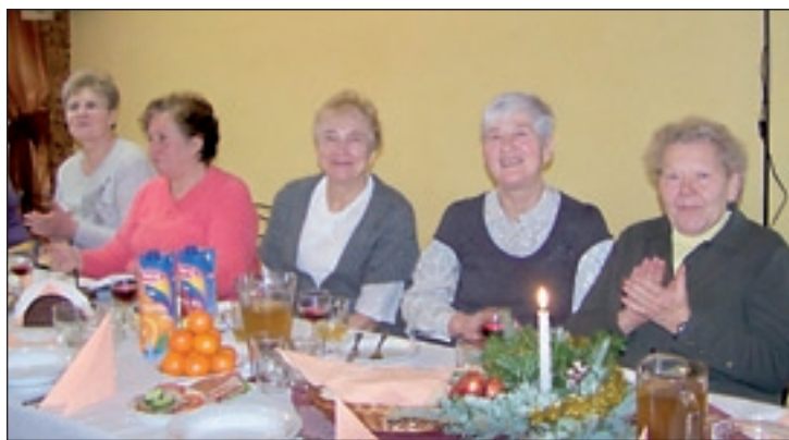
Spotkanie było okazją do przyjacielskich rozmów