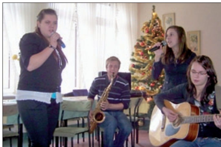
Uczniowie ZS Nr 2 zaśpiewali kolędy