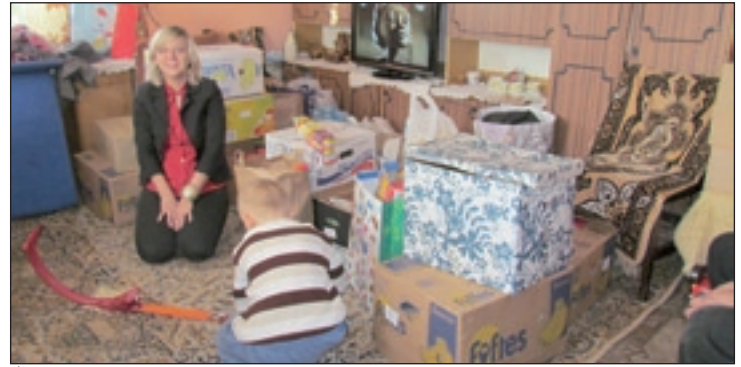
Świąteczne prezenty od „Szlachetnej Paczki” sprawiły radość niejednej rodzinie