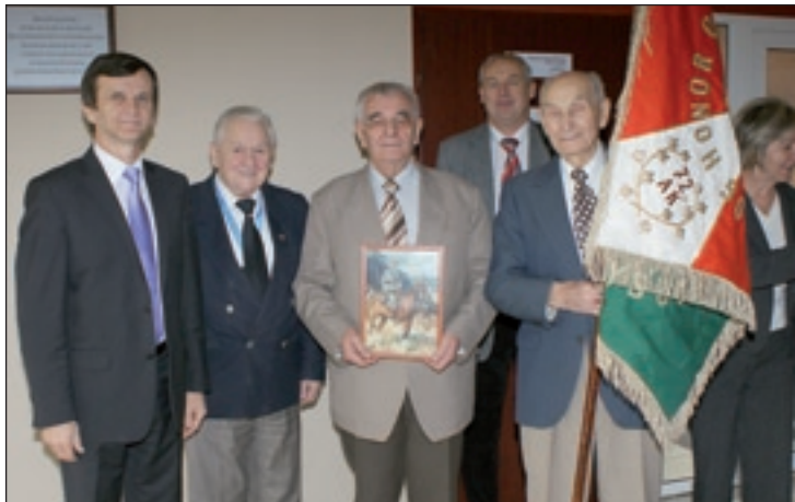
Uczestnicy uroczystego otwarcia siedziby koła SZZAK