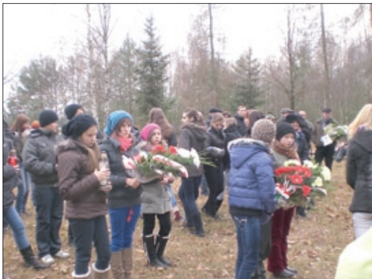
Młodzież oddała hołd Hubalczykom na Szańcu Hubala w Anielinie