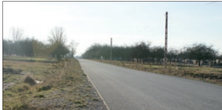
Nowa droga gminna Beżnik – Jamki