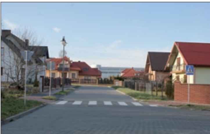
Nowe ulice na osiedlu Dembińskich w Przysusze

- To bez wątpienia problem bezrobocia. Z jednej strony faktem jest, że diametralnie w tym roku zmniejszyła się pula środków dla przysuskiego Powiatowego Urzędu Pracy na aktywne formy przeciwdziałania bezrobociu, ale z drugiej strony, nie mając swojego przedstawiciela w Powiatowej Radzie Zatrudnienia, pozbawieni byliśmy wpływu na zasady i wyniki podziału nawet tych zminimalizowanych środków na staże, prace interwencyjne czy roboty publiczne. Ze swej strony, aby stworzyć warunki dla prowadzenia działalności gospodarczej i tworzenia nowych miejsc pracy,