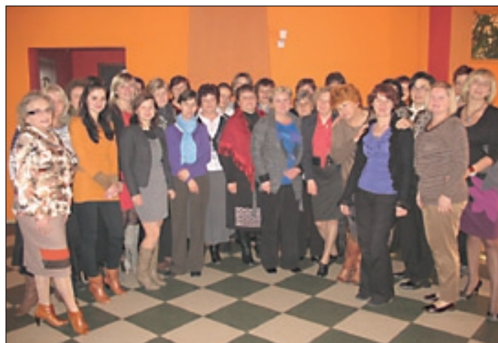
Pracownice ośrodków pomocy społecznej