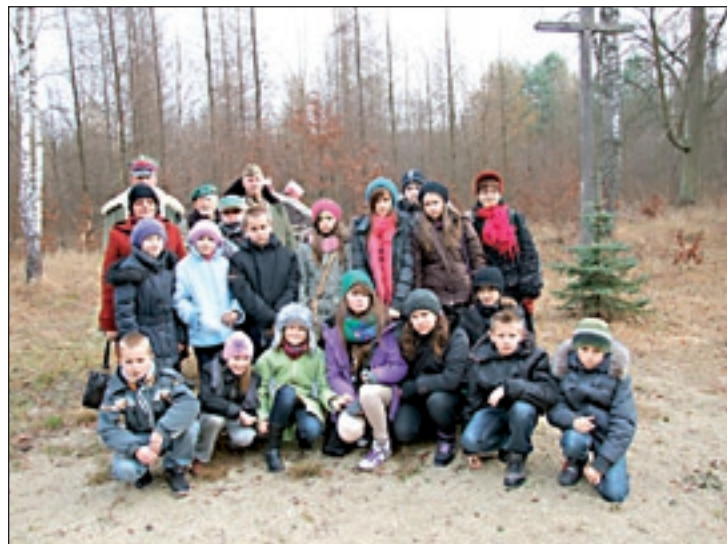
Uczniowie PSP z Ruskiego Brodu i ich opiekunowie na „Hubalowej Wigilii”