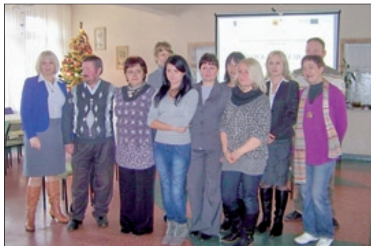
Uczestnicy projektu SZANSA

Uroczystość rozpoczęło przemówienie Prezydenta RP Bronisława Komorowskiego, który skierował do zebranych przesłanie za pośrednictwem nagrania wyświetlonego na telebimie. Wręczano nagrody w konkursie „Warszawa bez barier” i Medale „Przyjaciół Integracji”. Podczas gali wystąpili znani artyści: Ewelina Flinta, Olga Bończyk, mimowie z Teatru Akt oraz Grupa MoCarta, która za swój rewelacyjny występ zebrała największe brawo od rozbawionej publiczności.