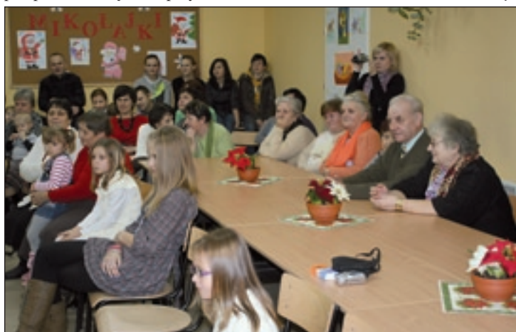
Mieszkańcy Pomykowa licznie uczestniczyli w Jasełkach