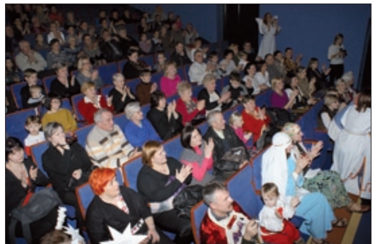
Babcie i dziadkowie gorąco oklaskiwali wykonawców i nie kryli wzruszenia.