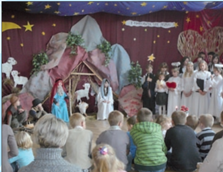
Jasełka u „Hubalczyków”

Pięknie zaśpiewali nasze polskie kolędy oraz pastorałki. Przedstawienie zakończyło wykonanie przez uczniów piosenek związanych ze świętem Bożego Narodzenia w języku angielskim. Były życzenia i momenty wzruszeń. Na zakończenie spotkania harcerze - uczniowie klasy szóstej wnieśli do sali Świąteczko Betlejemskie którym podzielił się ze wszystkimi i które zostało przekazane ks. proboszczowi tutejszej parafii.