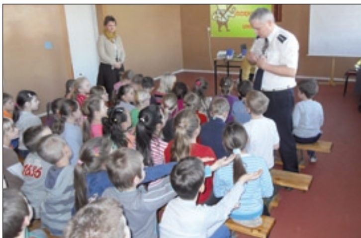
Uczniowie PSP 1 na spotkaniu z policjantem