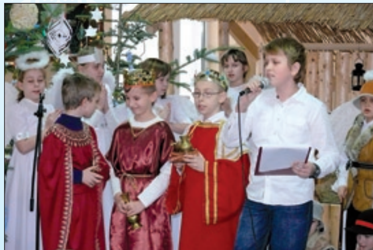
W PSP 2 śpiewano kolędy