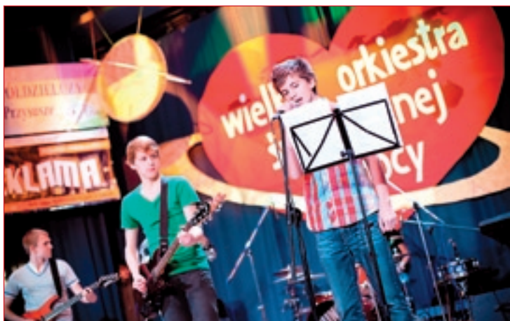
Na estradzie DK grały i śpiewały liczne zespoły.