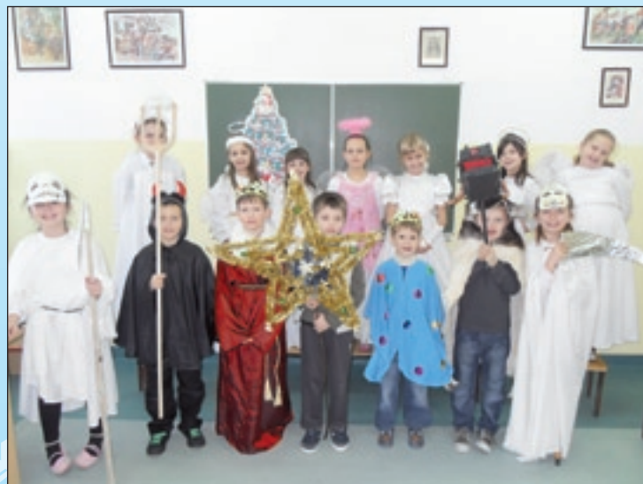
Kolędniczy z PSP nr 1 w Przysusze – S.U. „Maluch”