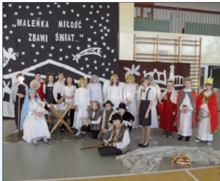
Uczniowie PSP 1 w inscenizacji Jasełek

Jasełka w Domu Kultury oczarowały wszystkich