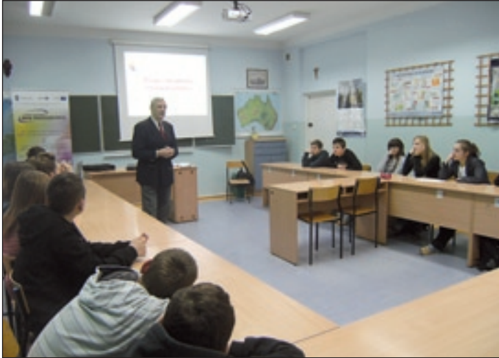
Gimnazjaliści - uczestnicy projektu podczas zajęć

Od marca do grudnia 2011 r. młodzież Publicznego Gimnazjum im. św. Stanisława Kostki w Przysusze brała udział w projekcie edukacyjnym „Jestem aktywny – będę przedsiębiorcą”. Projekt realizowany jest przez Lokalną Grupę Działania „Razem dla Radomki” w partnerstwie z Świętokrzyskim Centrum Innowacji i Transferu Technologii, Lokalną Grupą Działania „Perła Czarnej Nidy” oraz Samorządami Województwa Mazowieckiego i Świętokrzyskiego. Zakłada on promocję postaw przedsiębiorczych oraz innowacyjnego podejścia do rozwiązywania problemów powstających w procesie prowadzenia firmy, poprzez współdziałanie przedsiębiorców z uczniami szkół gimnazjalnych. Głównym celem projektu jest wprowadzenie kompleksowych usług wspierających rozwój przedsiębiorczości i promujących postawy przedsiębiorcze wśród różnych grup społecznych, mających wpływ na rozwój społeczno-gospodarczy (przedsiębiorcy, konsultanci, kadra nauczycielska, uczniowie gimnazjów) z regionu mazowieckiego.