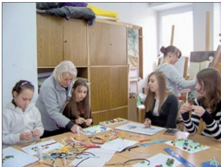
Uczestnicy zajęć w klubie plastycznym poznali quilling