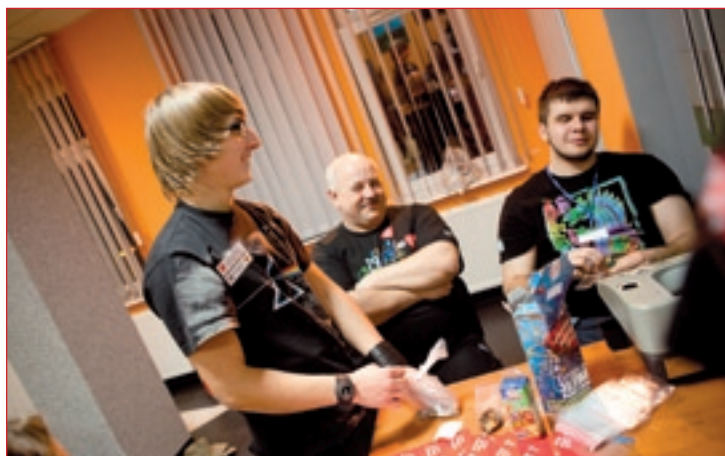
Członkowie przysuskiego sztabu WOŚP ...zadowoleni!

27.102 złote i 31 groszy zebrali wolontariusze XX Finału Wielkiej Orkiestry Świątecznej Pomocy grającej 8 stycznia w Przysusze. Kwestowało 94 wolontariuszy. Zarówno kwota zebranych pieniędzy, jak i liczba wolontariuszy była znacznie większa, aniżeli w latach poprzednich.