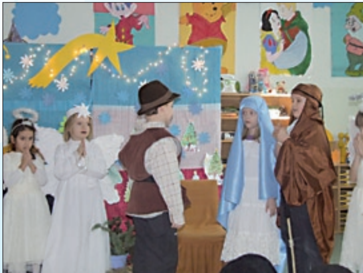
„W stajence” – inscenizacja sześciolatków z ZPO