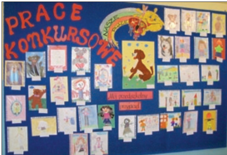
Na konkurs plastyczny w przedszkolu nadesłano wiele prac

Na konkurs nadesłano 36 prac, wykonanych różnymi technikami plastycznymi. Ich oceny i rozstrzygnięcia konkursu dokonała jury, w skład którego weszły dzieci pięcioletnie z naszego przedszkola, nauczyciele i dyrektor placówki. Zwycięzcy w poszczególnych kategoriach wiekowych otrzymali książki, pozostałe prace nagrodzone zostały dyplomami i malowaniami.