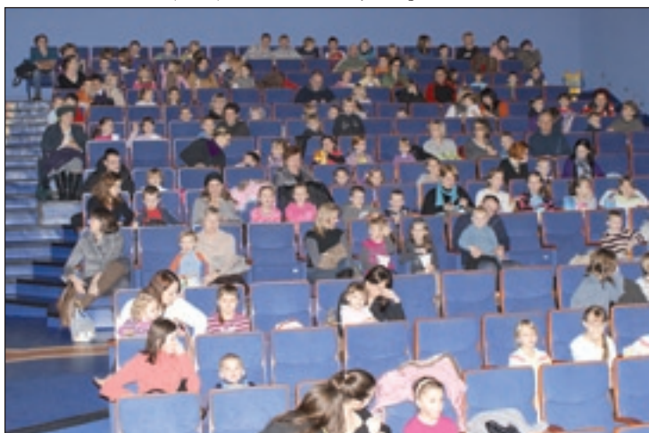
Najmłodszy przysuszanie bardzo licznie uczestniczyli w projekcjach bajek