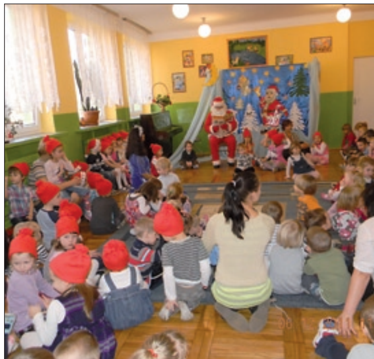
Przedszkolaki cieszyły się z wizyty św. Mikołaja

Jak co roku, tak i w ubiegłym, św. Mikołaj odwiedził dzieci w Samorządowym Przedszkolu Nr 1 w Przysusze. Na Mikołaja z niecierpliwością czekały wszystkie przedszkolaki. Mimo, że jest to już sędziwy staruszek, to z wielką radością uczestniczył we wspólnych zabawach z dziećmi, wysłuchał