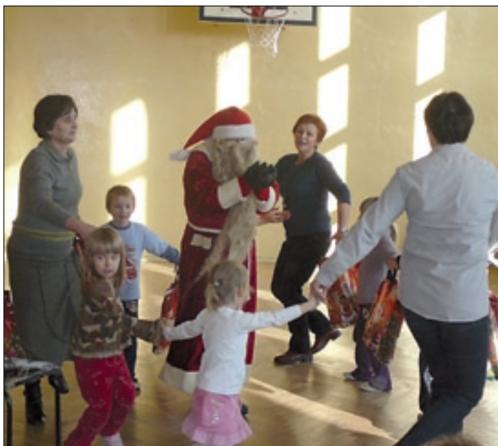
W PSP, w Ruskim Brodzie dzieci gościły św. Mikołaja

„Przyjedź do nas Mikołaju z workiem aż do nieba, przywieź radość i prezenty dla nas, dla każdego” - śpiewały dzieci w szkole, w Ruskim Brodzie, nasłuchując czy nie słychać zbliżającego się gościa. Tradycją stało się, że św. Mikołaj w dniu swoich imienin odwiedza tę szkołę. Przynosi paczki, nie różgi, gdyż wszystkie dzieci starają się być grzeczne przez cały rok. Nie jest to łatwe, bo każdy uczniowski wybryk w małej szkole jest natychmiast