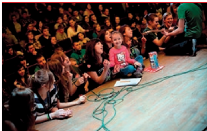
Na koncercie publiczność bawiła się świetnie.