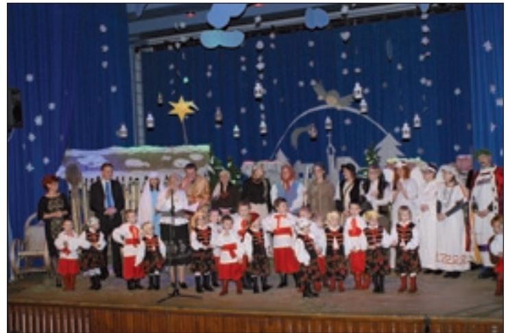
Wykonawcy koncertu dla babć i dziadków.