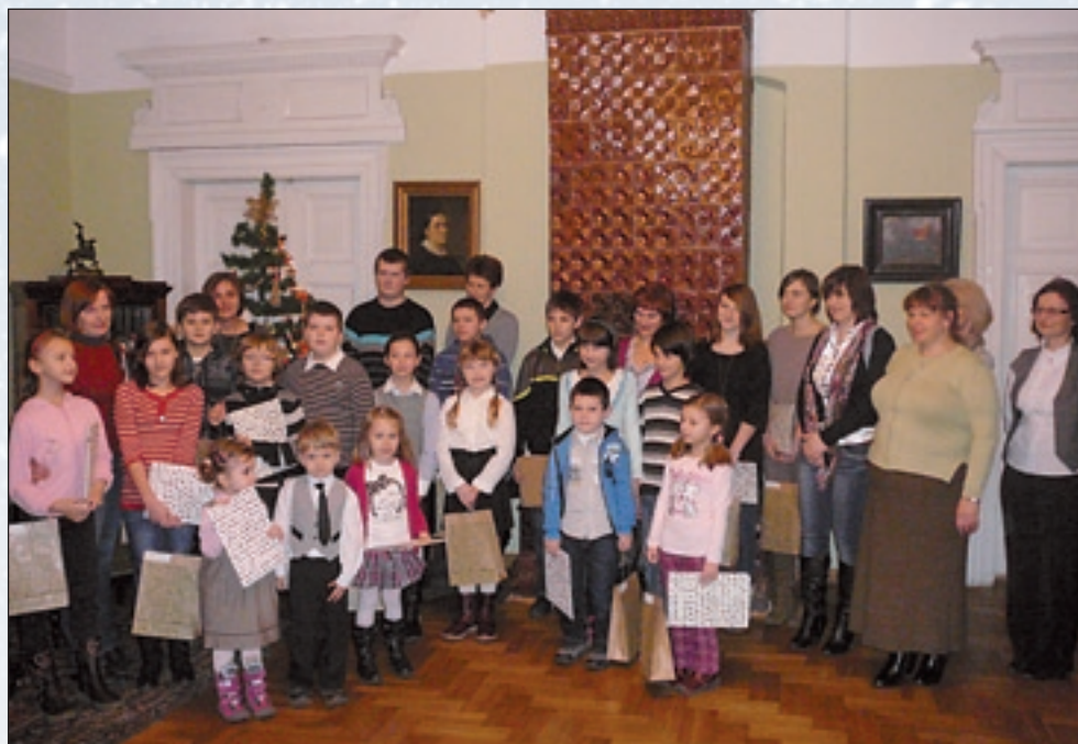
Laureaci konkursu muzealnego