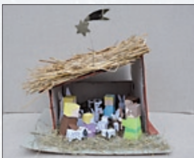
Wyróżniona praca Kuby Zabronia