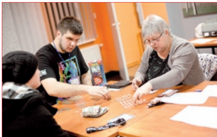
Komisyjne liczenie „wkładów” puszek