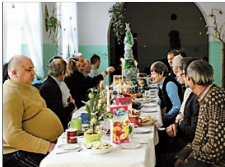
Wigilia w Środowiskowym Domu Samopomocy w Ruskim Brodzie

lijne rozpoczęło się od odczytania przez jednego z podopiecznych słów ewangelii według św. Łukasza oraz złożenia życzeń przez kierownictwo ŚDS i Fundacji „RAZEM”. Wspólnie spożyto wieczerzę, składającą się z dwunastu tradycyjnych potraw. Wszystkie własnoręcznie przygotowały podopieczni placówki. Kolędy śpiewano przy akompaniamencie gitary. Wigilijnemu spotkaniu w ŚDS towarzyszyła rodzinna atmosfera.