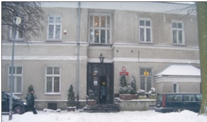
Budynek Sądu Rejonowego w Przysusze