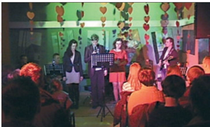
Koncert walentynkowy odbył się w sali kameralnej DK