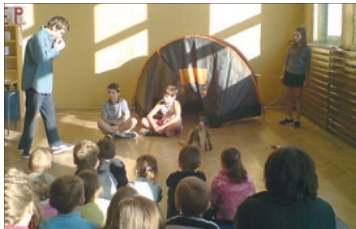
Szkolny teatr POMIMO

10 lutego w PSP w Ruskim Brodzie zagościli aktorzy ze szkolnego teatru POMIMO. Przyjechali do szkoły w Ruskim Brodzie z PSP w Skrzyńsku i zaprezentowali sztukę pt. „Może trzeba Ci pomóc?...” na podstawie powieści „Ten Obcy” I. Jurgielewiczowej. Świetna gra aktorów oraz scenografia mile za-