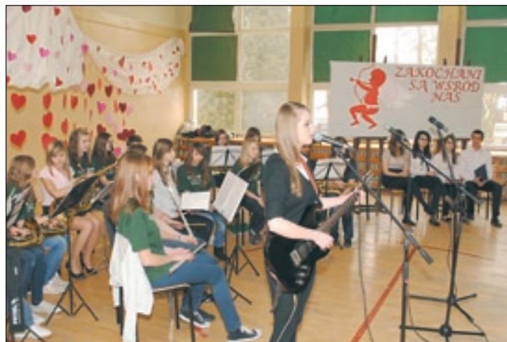
Walentynkowy koncert w ZS nr 1

muzyki, wszystkie dzieci świetnie się bawiły. Czas zabawy urozmaiciły im konkursy karnawałowe, między innymi wybrano Króla i Królową Balu. „Koronowane głowy” miały trzyminutową sesję zdjęciową. Nie