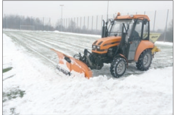
Pracownicy PSK systematycznie odśnieżali boiska Orlik