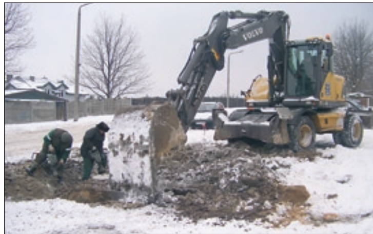
Usuwanie jednej z awarii na osiedlu Południe