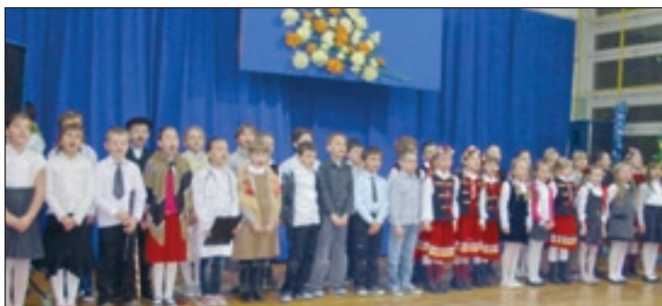
Piosenką i wierszem uczniowie PSP w Skrzyńsku złożyli życzenia babciom i dziadkom