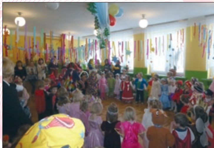
Karnawałowy bal w przedszkolu nr 1