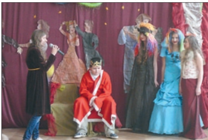
Szkolny kabaret uatrakcyjnił choinkową zabawę w PSP w Ruskim Brodzie