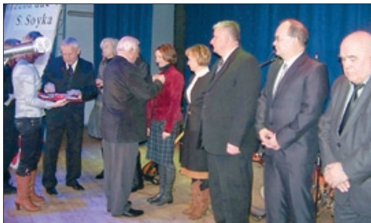
Moment wręczenia Odznak Honorowych PCK