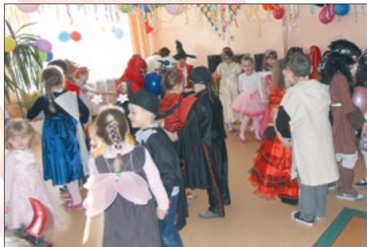
Bal w oddziałach przedszkolnych PSP nr 1 w Przysusze

ły tiulowe suknie i szeleściły piękne kotyliony. W trakcie balu odbył się pokaz karnawałowych strojów i konkurs tańca z balonikami. Na wszystkich uczestników balu czekał słodki poczęstunek. Zabawa była udana, a wspomnienia na długo pozostaną w pamięci dzieci.