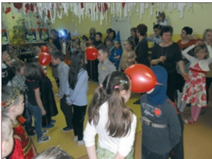
Taniec z balonikiem na balu w PSP nr 1

Natomiast dzień później, 15 lutego odbyła się zabawa karnawałowo - walentynkowa dla klas młodszych. Na tle wspaniałej, serduszkowej dekoracji, przy dźwiękach tanecznej