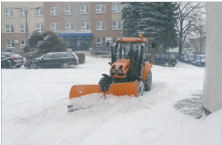
Ciągnik z osprzętem do odśnieżania i posypywania pomocny był przy odśnieżaniu ulic w mieście