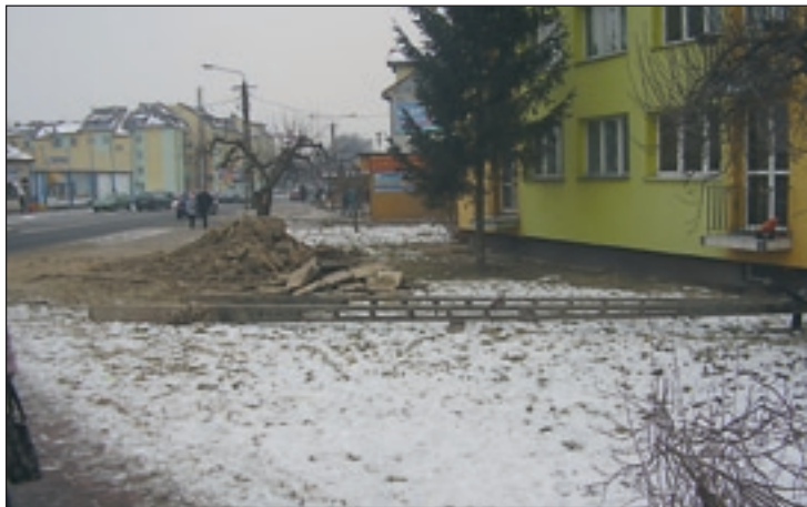
Usunięcie awarii u zbiegu ulic Radomskiej i Legionów wymagało usunięcia słupa energetycznego

niczny wodomierza, w tym zabezpieczenie go przed skutkami niskich temperatur. Tak mówi gminny regulamin dostarczania wody i odprowadzania ścieków i taki zapis widnieje w umowach z odbiorcami. Wracając jeszcze do awarii sieci wodociągowej, to niestety sieć jest stara i wymaga wymiany. To bardzo kosztowna inwestycja, ale z tym problemem trzeba się będzie zmierzyć. Podejmę rozmowy na ten temat z władzami gminy i spółdzielnią mieszkaniową. Dla naszego przedsiębiorstwa usuwanie takich awarii, jakie miały miejsce tej zimy, to potężny koszt. Na same tzw. opaski wydaliśmy przeszło 7 tys. zł. Poza tym każdy wyciek wody, to dla naszej firmy strata – dodaje prezes PGKiM.