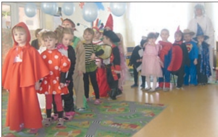
W przedszkolu nr 3 bawiono się w Zimowej Krainie