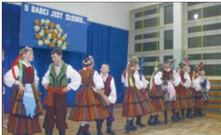
Zatańczył i zaśpiewał zespół „Kukuleczki”

Uroczyste spotkania uczniów Publicznej Szkoły Podstawowej w Skrzyńsku z babciami i dziadkami to piękna tradycja placówki. Sala gimnastyczna szkoły zamienia się w takiej chwili w salę widowiskową, wypełnioną zaproszonymi gośćmi, dla których uczniowie – wnuki i wnuczki, przygotowują występy artystyczne. Wszystkim seniorom wszyscy składają najpiękniejsze życzenia.