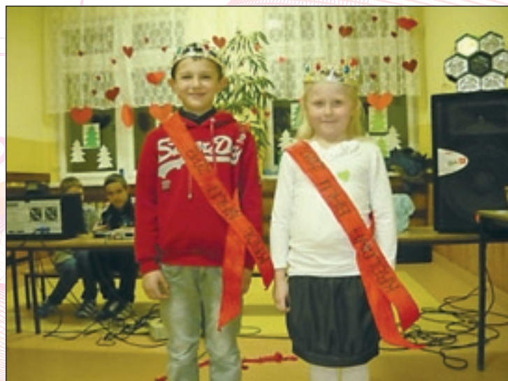
Król i królowa karnawałowo - walentynkowej zabawy w PSP 1

obyło się także bez słodkich poczęstunków przygotowanych przez rodziców i przez same dzieci. Pełni wrażeń, z uśmiechami na twarzach wszyscy szczęśliwie wrócili do domów.