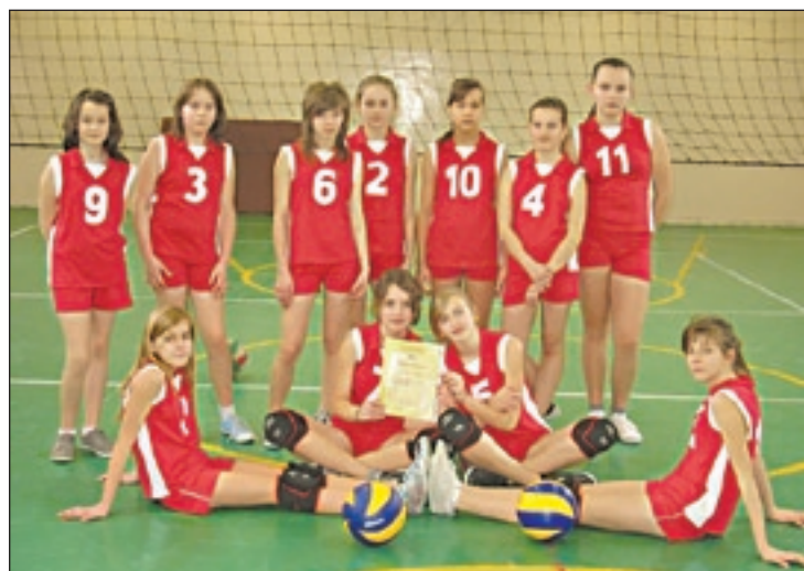
Drużyna siatkarek z PSP nr 2