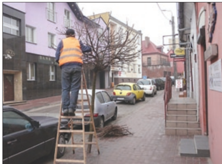
Pielęgnacyjne przycinanie drzew

Zajęcia rozpoczęły się w grudniu 2011 roku. W ramach projektu doposażono placówki w sprzęt i pomoce dydaktyczne. Zakupiono m.in. laptop, rzutnik multimedialny wraz z ekranem oraz specjalistyczne oprogramowanie komputerowe do diagnozy i terapii logopedycznej oraz dysleksji, zakupiono gry logiczne wspierające rozumienie pojęć matematycznych, publikacje do rozwoju umiejętności ortograficznych oraz multimedialne gry edukacyjne.