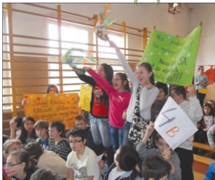
W PSP 1 rywalizowali też kibice