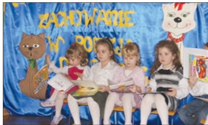
Przedszkolaki z dyplomem recytatora