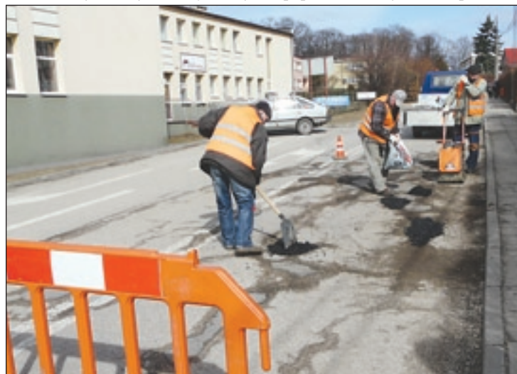
Naprawa nawierzchni ulicy Jana Pawła II