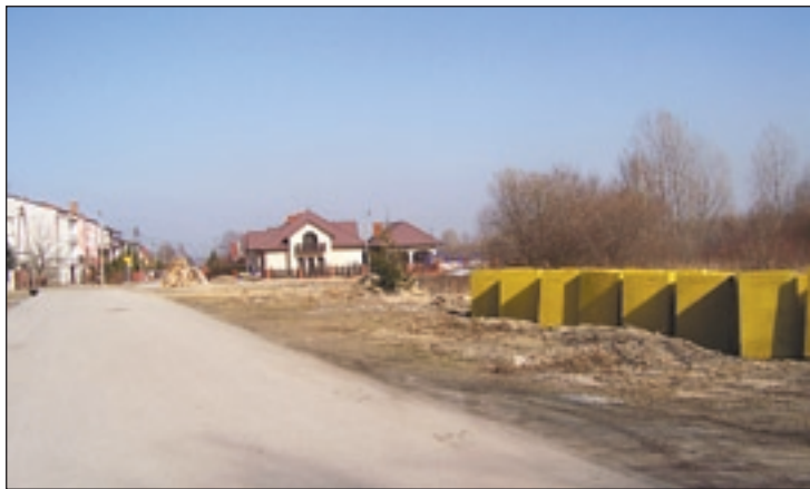
Przy ulicy Czermińskiego w Przysusze szybko rozwija się jednorodzinne budownictwo mieszkaniowe