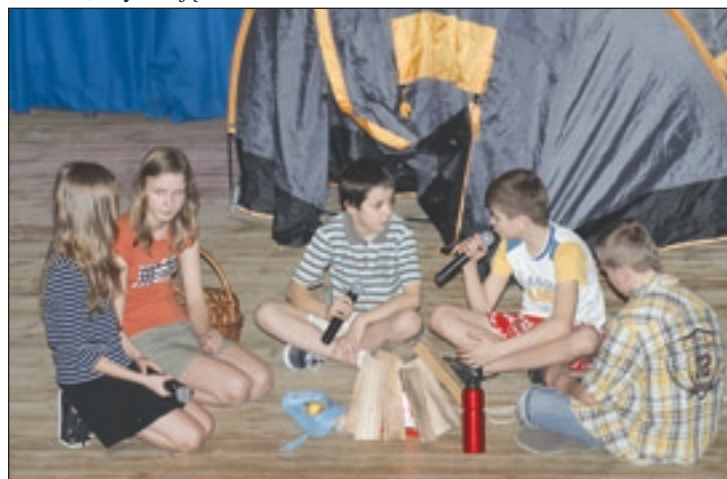
Szkolny Teatr „Pomimo” występował w Domu Kultury