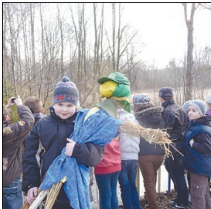
Uczniowie PSP 2 topili Marzannę

W Publicznej Szkole Podstawowej nr 2 wiosnę przywitano organizując wiele konkursów i zabaw. Młodzi uczniowie udali się nad zalew w Toporni i „utopili” Marzannę. Dzieci żegnały Panią Zimę śpiewając piosenki o tematyce wiosennej. Następnie wszyscy wzięli udział w zorganizowanym przez Samorząd Szkolny pokazie talentów. Uczestniczyli w nim uczniowie wszystkich klas oraz oddziały przedszkolne. Usłyszeliśmy piękne piosenki i wiersze, oczywiście o wiosnie. Był też występ taneczny klasy 5, mini koncert na saksofonie uczninicy kl.6b i barwny pokaz mody. Uczniowie kl. 4 przywitani wiosnę w Muzeum Wsi Radomskiej. Wszystkim dopisywały wspaniałe humory.