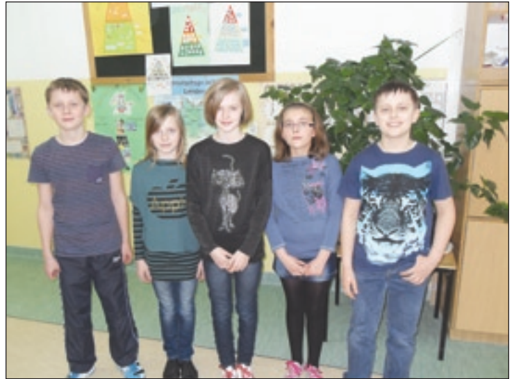
Laureaci konkursu ortograficznego