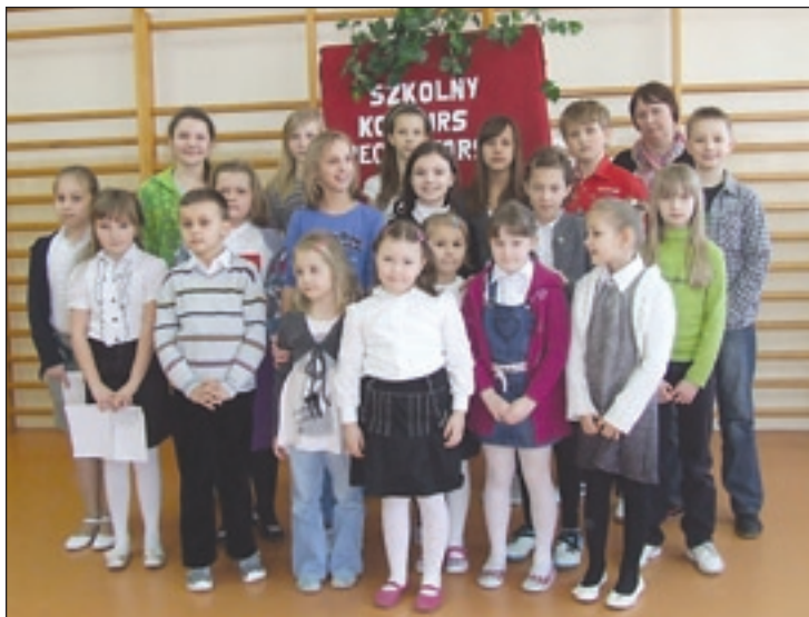
Uczestnicy konkursu recytatorskiego w PSP nr 2