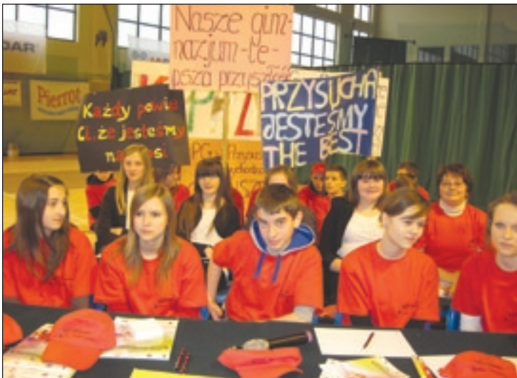
Członkowie IKP przysuskiego gimnazjum