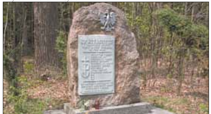
Obelisk przy gajówce Rawicz