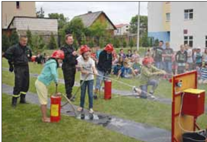
Wspólna zabawa u strażaków

Dla uczniów przysuskich szkół w Dzień Dziecka swoiste atrakcje przygotowała też Komenda Powiatowa Policji w Przysusze. Dzieci mogły zobaczyć jak wygląda Komenda od wewnątrz, porozmawiać o pracy policjantów, zobaczyć środki przymusu bezpośredniego, znajdujące się na wyposażeniu Policji oraz zwiedzić pomieszczenie oficera dyżurnego.