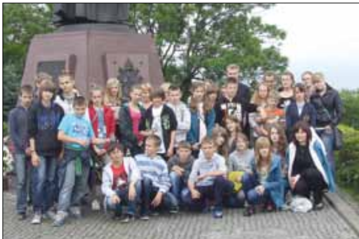
Uczestnicy pielgrzymki do Częstochowy