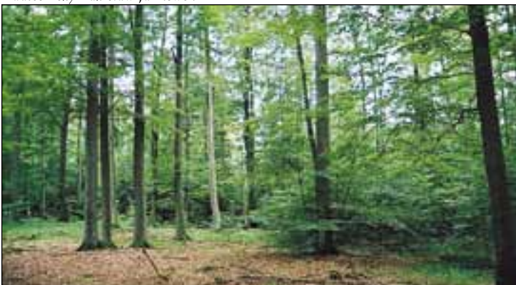
Rezerwat puszcza u źródeł Radomki