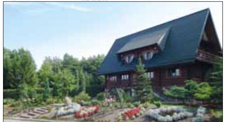
Budynek Nadleśnictwa Przysucha