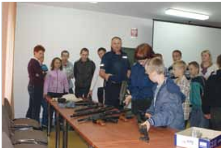
Spotkanie z policjantami

Natomiast w Samorządowym Przedszkolu Nr 1 w Przysusze Dzień Dziecka przebiegał w atmosferze sportowej. Przedszkolaki odśpiewały „hymn sportowy”, powitały się sportowymi okrzykami i uczestniczyły w zabawach i grach. Był wyścig z woreczkiem, bieg z przeszkodami, wyścig w workach, skoki z piłeczką i rzuty do obręczy. Spartakiada była dla dzieci