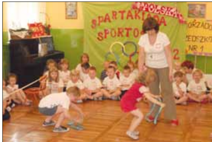
Spartakiada w przedszkolu

symbolem swobody i radości. Proponowane konkurencje pozwoliły na wykazanie się samodzielnością, wytrzymałością, umiejętnościami zespołowego działania, inicjatywą, stwarzały okazję do zdrowego współzawodnictwa. Nie zabrakło również wspólnych zabaw integracyjnych. Przedszkolaki za sportowe zmagania otrzymały dyplomy, medale i słodkie niespodzianki.