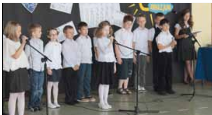
Szóstoklasiści PSP 2 przygotowali pożegnalny apel