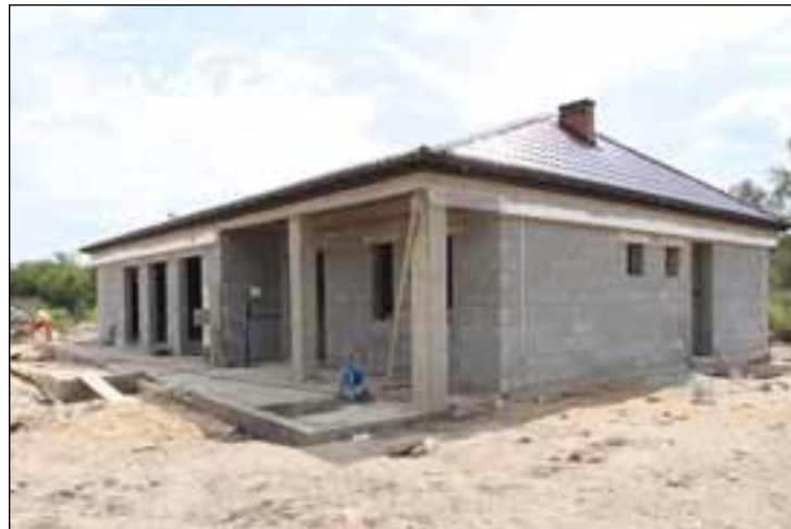
Trwają prace przy budowie placówki kultury w Kozłowcu