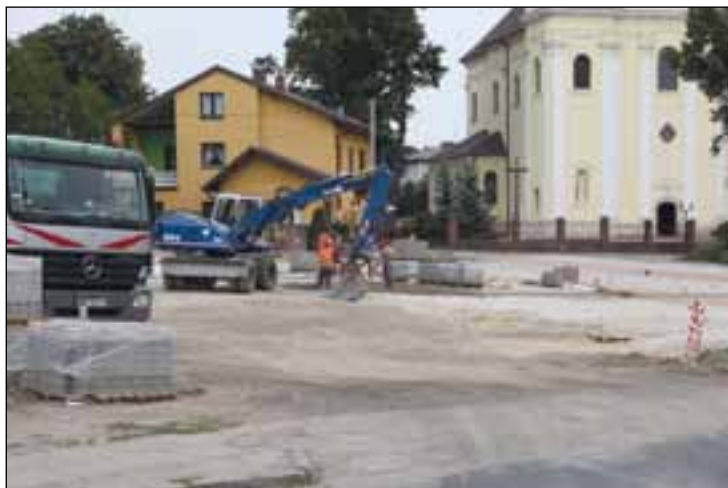
W centrum Skrzyńska powstaną parkingi i drogi dojazdowe