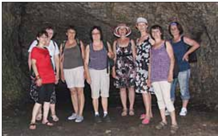
Nauczyciele na wycieczce po Jurze Krakowsko - Częstochowskiej.