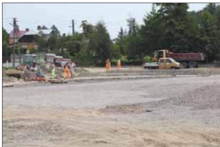
Prace przy zagospodarowywaniu centrum Smogorzowa