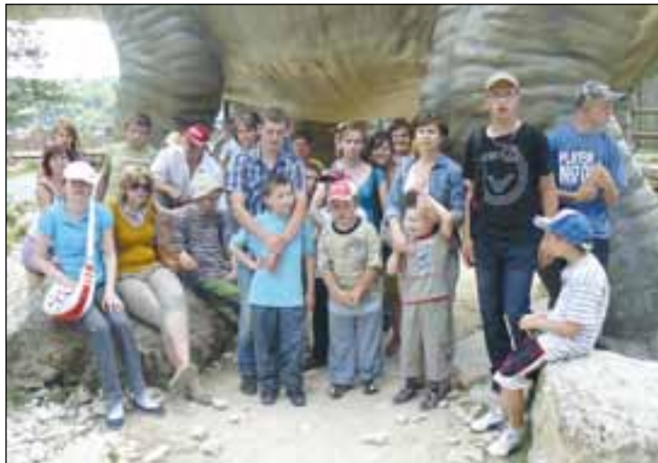
Uczestnicy wycieczki do Bałtowa.