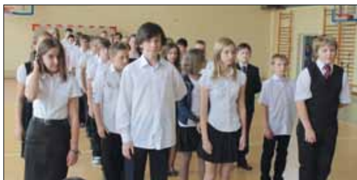
Były kwiaty, nagrody i wyróżnienia