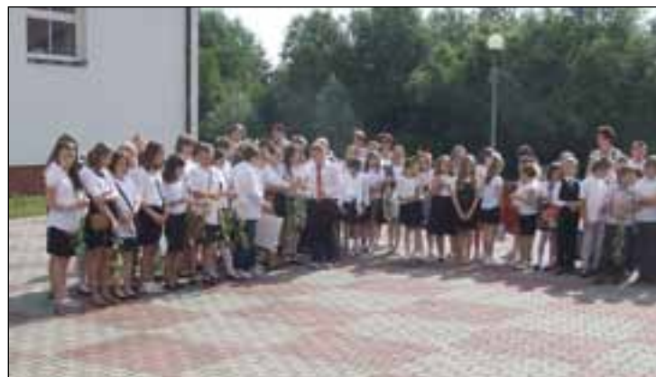
Szóstoklasiści PSP 2 przygotowali pożegnalny apel