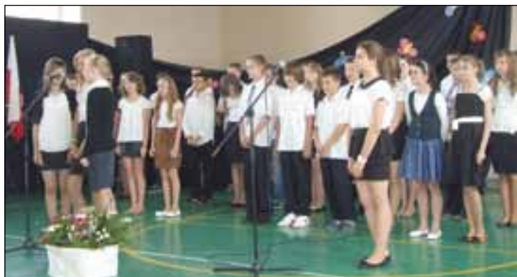
Były kwiaty, nagrody i wyróżnienia