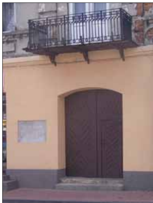
Kamienica, na której umieszczono tablicę upamiętniającą Oskara Kolberga

O wyglądzie takiej formy pomnika ma zdecydować konkurs na projekt. Ten zaś ma powstać we współpracy z Lokalną Grupą Działania „Razem dla Radomki”.