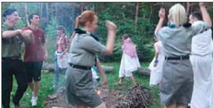
Uczestnicy rajdu bawili się przy ognisku.