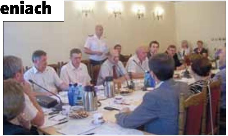
Radni wysłuchali informacji o ochronie przeciwpożarowej i przeciwpowodziowej w gminie i mieście.

Lato to jednak czas wakacji i radni chcieli wiedzieć, jaką ofertę dla dzieci i młodzież spędzającej w mieście wolny czas od nauki przy-