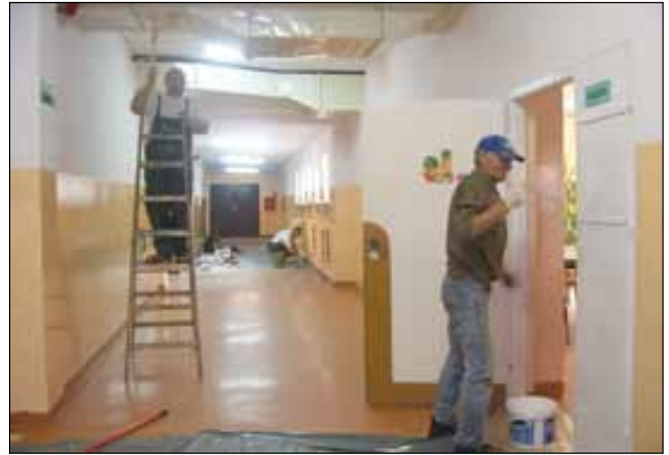
Malowanie korytarzy w PSP1 w Przysusze

W Publicznej Szkole Podstawowej w Ruskim Brodzie zakres wakacyjnych prac obejmuje np. uzupełnienie elewacji zewnętrznej na sali gimnastycznej od strony zachodniej, uzupełnienie odprysków tynku na lamperii w korytarzu, malowanie klatki schodowej prowadzącej do gabinetu dyrektora szkoły, malowanie klatki wejściowej do kuchni i biblioteki publicznej od strony boiska. W Publicznej Szkole Podstawowej w Skrzyńsku zaplanowano malowanie sali gimnastycznej, naprawę rynien i rur spadowych od strony zachodniej, malowanie sali poloni-