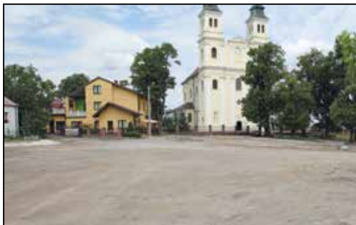
Taki wygląd centrum Skrzyńska to już historia