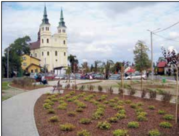
Centrum Skrzyńska dziś