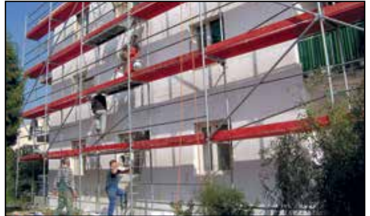
Prace przy docieplaniu budynku przy ul. Krętej 7