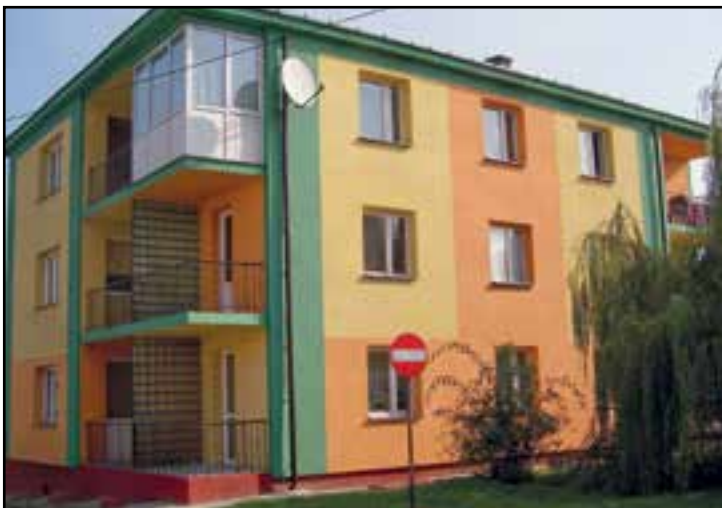
Budynek przy ul. Krętej 9 jest docieplony i zyskał nową elewację