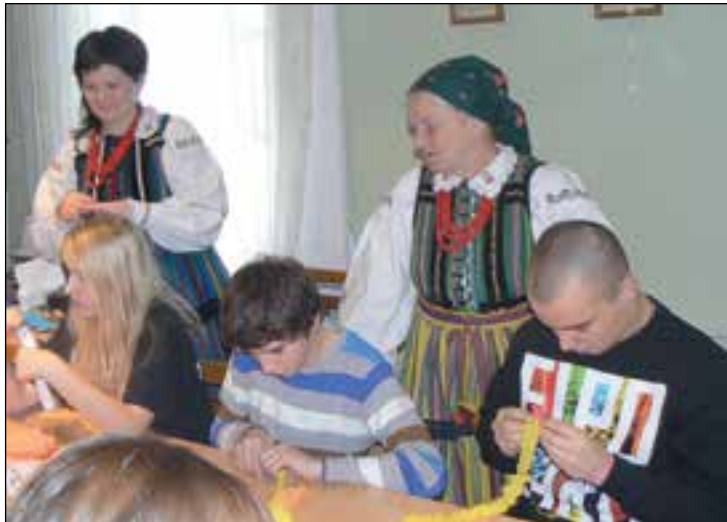
W muzeum pokaz prowadziły twórczynie ludowe