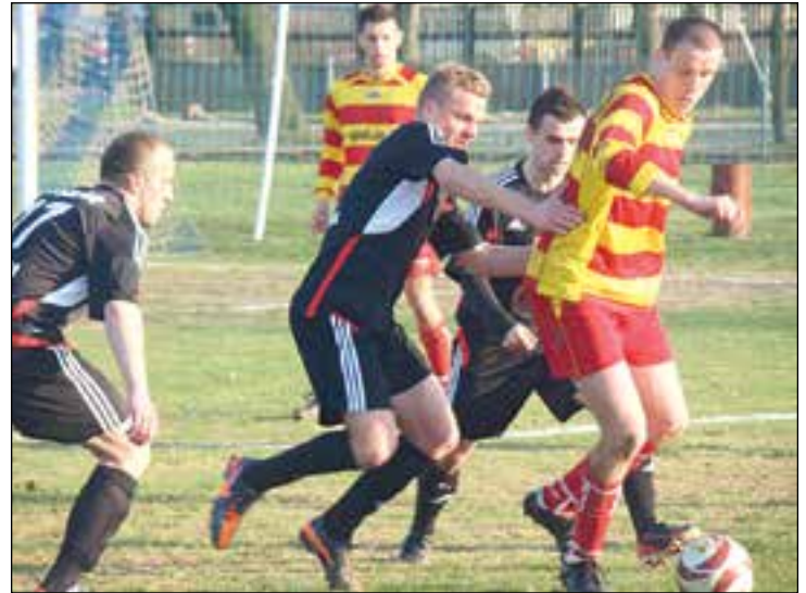
Pierwszy mecz rundy wiosennej: „Oskar” - Iłzanka Kazanów.

jowych. Finał międzypowiatowy odbył się 15 kwietnia w Piastowie i uczestniczyło w nim piętnastu biegaczy z przysuskiego gimnazjum. Wymieniona trójka pobiegnie dalej.