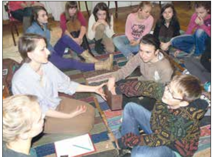
Warsztaty dla uczniów