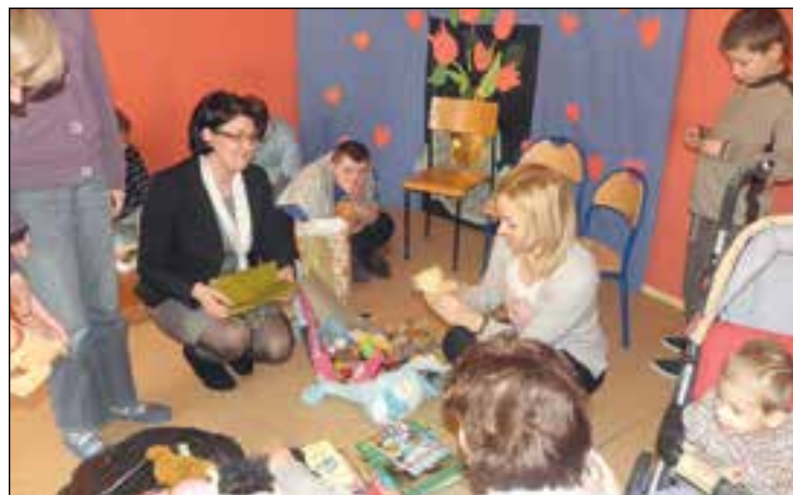
Moment przekazania dzieciom zabawek i książek