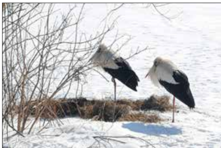
Bociany szczęśliwie przeżyły przedłużającą się zimę