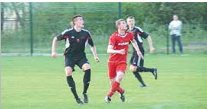
Z meczu Oskar – Zawisza Sienno