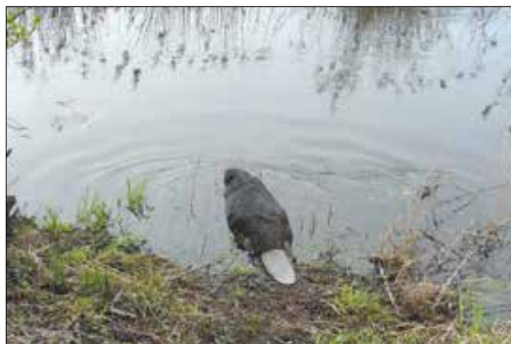
Bóbr znalazł swoje miejsce w dolinie Radomki