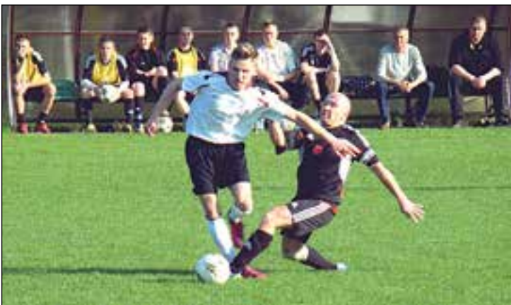
Z meczu Oskar – Plon Garbatka

Ostatecznie dziewczęta UKS Jedynka Przysucha zajęły IX miejsce.