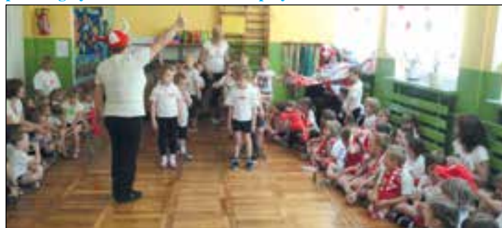
Przedszkolaki na starcie

Spartakiady sportowe zorganizowały z okazji Dnia Dziecka przysuskie placówki oświatowe. Zawody uatrakcyjnione słodkim poczęstunkiem przebiegały w atmosferze walki fairplay.