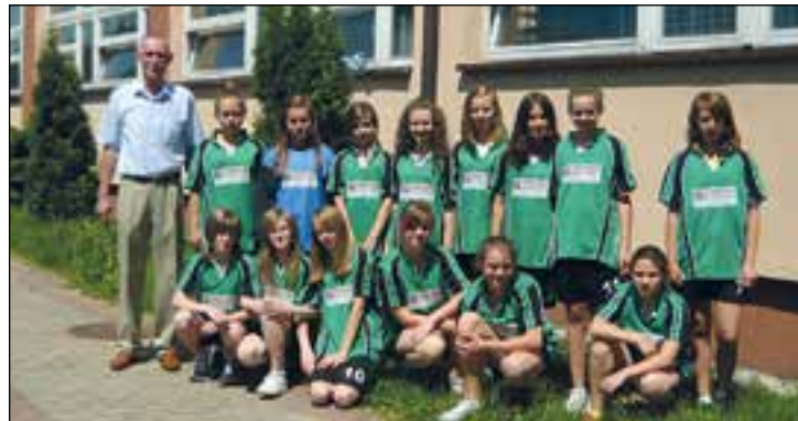
Uczennice PSP nr 1 w Przysusze