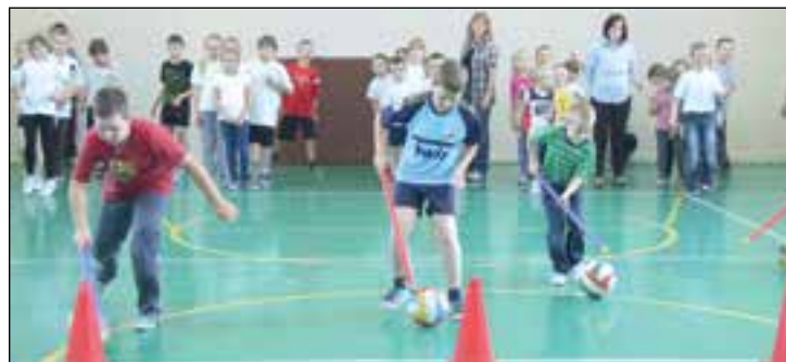
Uczniowie w akcji

W Publicznej Szkole Podstawowej nr 2 młodzi uczniowie współzawodniczyli w wielu ciekawych i zabawnych konkurencjach na sali gimnastycznej, natomiast starsi mieli możliwość obejrzenia ciekawych prezentacji – z pobytu klas 5-6 na zielonej szkole w Szklarskiej Porę-